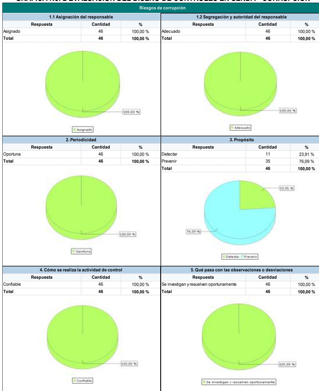
GRÁFICA No. 2 EVALUACIÓN DEL DISEÑO DE CONTROLES EN SENDA - CORRUPCIÓN