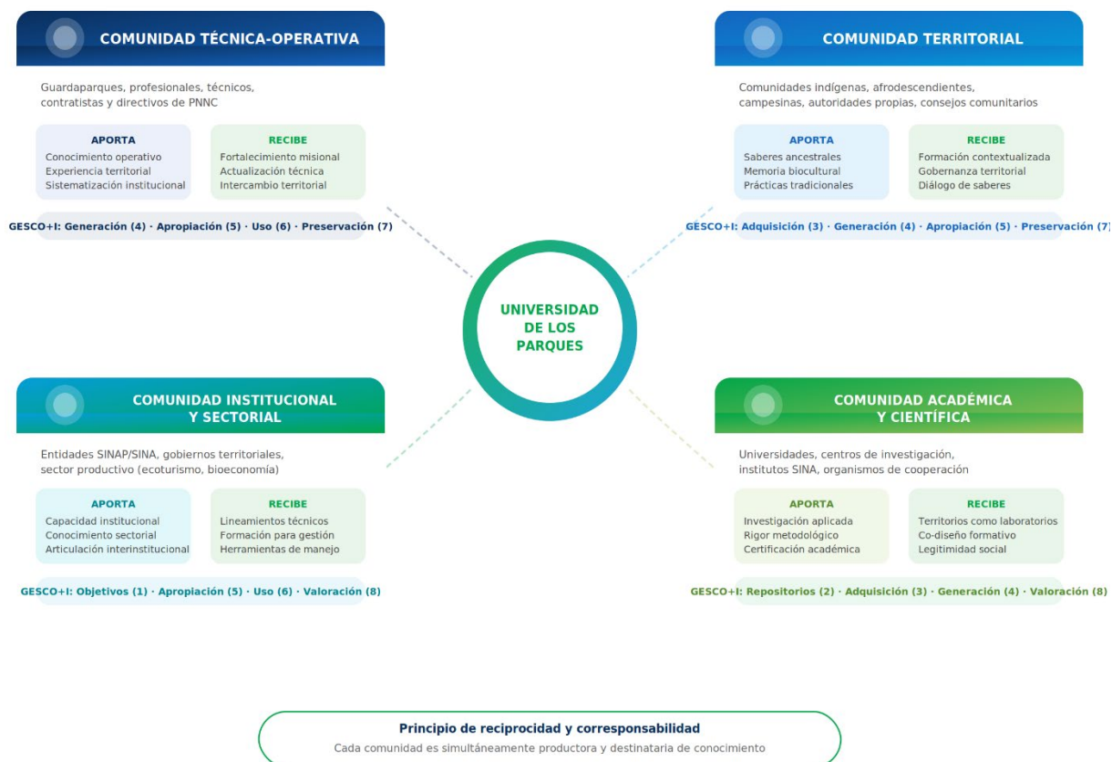
Figura 1. Mapeo de Actores