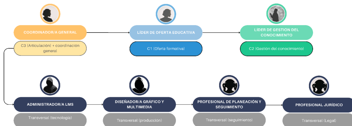
Figura 3. Diagrama Nivel Central