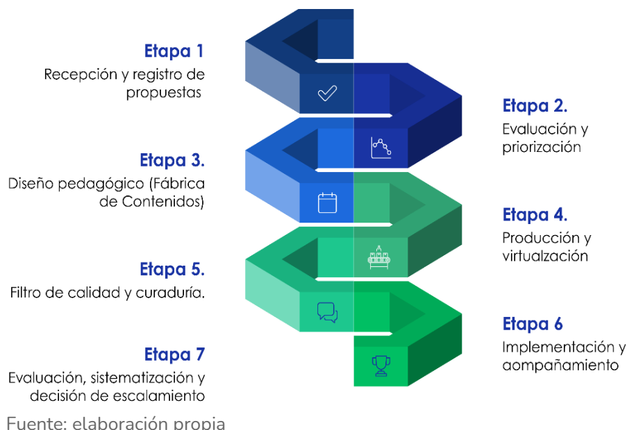
Figura 4. Etapas de cumplimiento