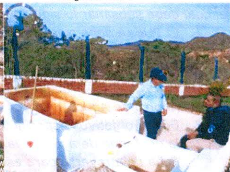
Planta de tratamiento de Agua Potable Cooserplay