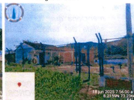
Planta de tratamiento de Agua Potable Cooserplay.