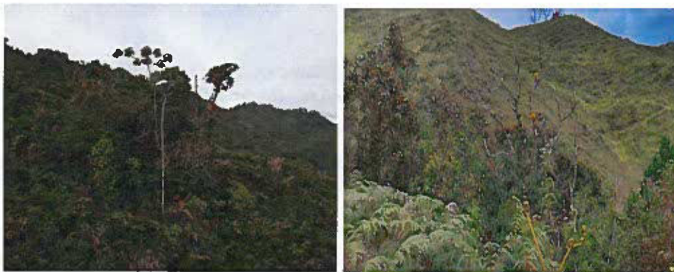
Imágenes 1 y 2. Ecosistemas presentes en la RNSC "RESERVA NATURAL MESENIA PARAMILLO LOS GURRES".

De acuerdo a la capa de Ecosistemas para Colombia 6 y a la visita técnica realizada, la RNSC "RESERVA NATURAL MESENIA PARAMILLO LOS GURRES", se encuentra localizada en un rango altitudinal entre 1910 msnm hasta 2185 msnm, encontrando que el tipo de ecosistema natural presente en ambos predios corresponde a Bosque Altoandino y Subandino , representados por bosques densos de gran altura llegando hasta los 25 metros. Adicionalmente, se compone por rastrojos bajos, relictos de vegetación secundaria y bosque de galería (Imágenes 1 y 2). Esta información se complementa con la capa de ecosistemas de Colombia 2018 (IDEAM).