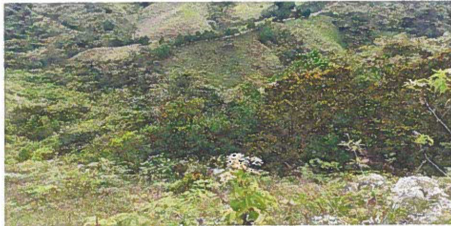
Imagen 3. Zona de Restauración de la RNSC "RESERVA NATURAL MESENIA PARAMILLO LOS GURRES".

POR MEDIO DE LA CUAL SE REGISTRA LA RESERVA NATURAL DE LA SOCIEDAD CIVIL "RESERVA NATURAL MESENIA PARAMILLO LOS GURRES"