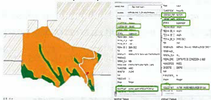
Figura 2. Traslape del RNSC "RESERVA NATURAL MESENIA PARAMILLO LOS GURRES", con expedientes 506162 Y 501529.

Ante esto, desde la DTAO se ofició, mediante radicado No. 2024603000740 del 27 de noviembre del 2024, la solicitud de información ante el solicitante ANDES RESOURCES EP S.A.S., acerca de estos traslapes y se recibió como respuesta lo siguiente: