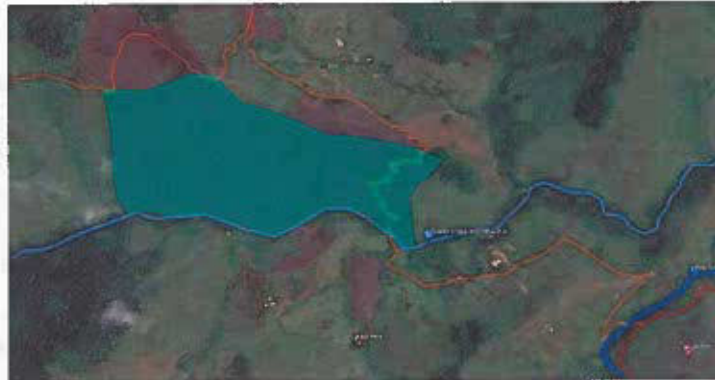
Figura 5. Presencia de Quebrada denominada "La Cristalina" que delimita la RNSC "RESERVA NATURAL MESENIA PARAMILLO LOS GURRES" ubicada en el Municipio de Andes, departamento de Antioquia.

FMI No. 004-1146 y cédula catastral No. 050340006000000610021000000000, los cuales se encuentran ubicados en el municipio de Andes, departamento de Antioquia, como Reserva Natural de la Sociedad Civil a denominarse "RESERVA NATURAL MESENIA PARAMILLO LOS GURRES", de acuerdo con la visita técnica realizada, se evidenció la presencia de la Quebrada la Cristalina, como se muestra en la Figura 5.