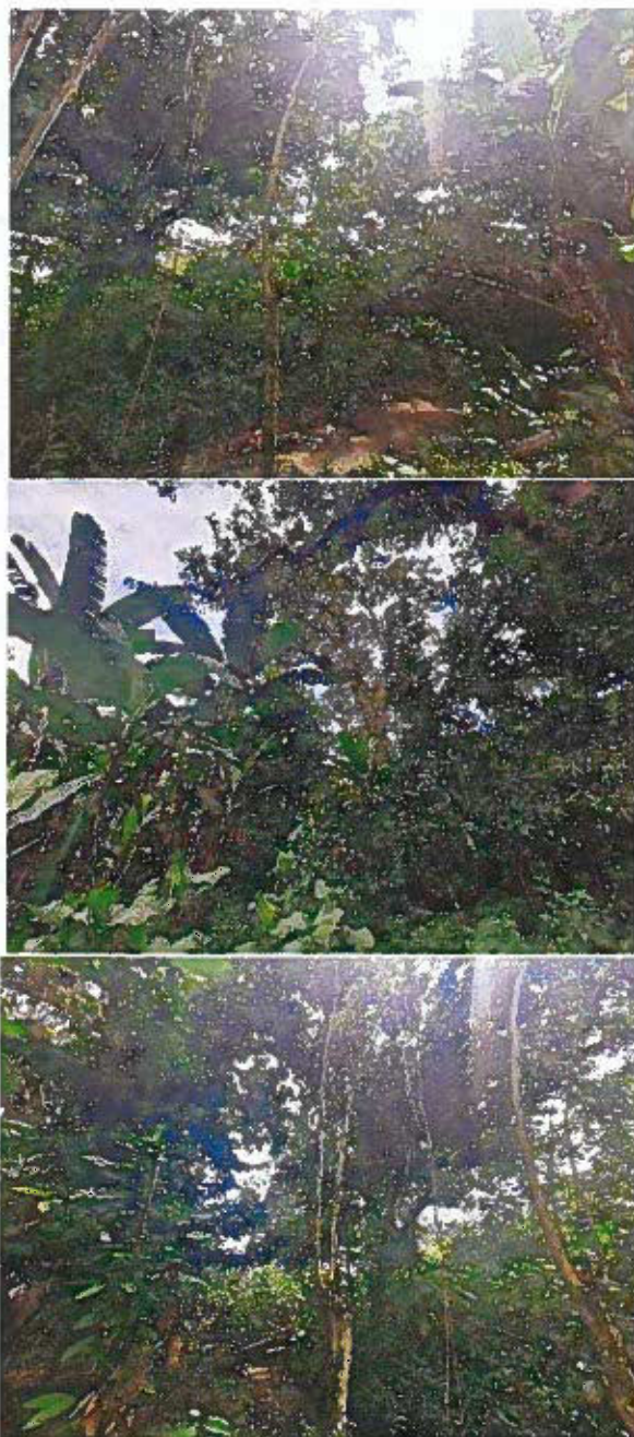
Imagen 1. Cobertura vegetal evidenciada durante la visita técnica de seguimiento, las especies que predominan son los cultivos de cacao y plátano en arreglo agroforestal con poca presencia de especies típicas del Bosque Seco Tropical del Piedemonte Aluvial (BOCSEP).

POR MEDIO DE LA CUAL SE CANCELA EL REGISTRO DE LA RESERVA NATURAL DE LA SOCIEDAD CIVIL RNSC 047-13 "VILLA ANDREA" Y SE TOMAN OTRAS DETERMINACIONES