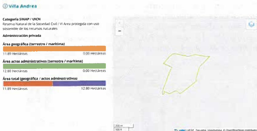
Figura 1. Reserva Natural de la Sociedad Civil "VILLA ANDREA" en el Registro Único Nacional de Áreas Protegidas – RUNAP.