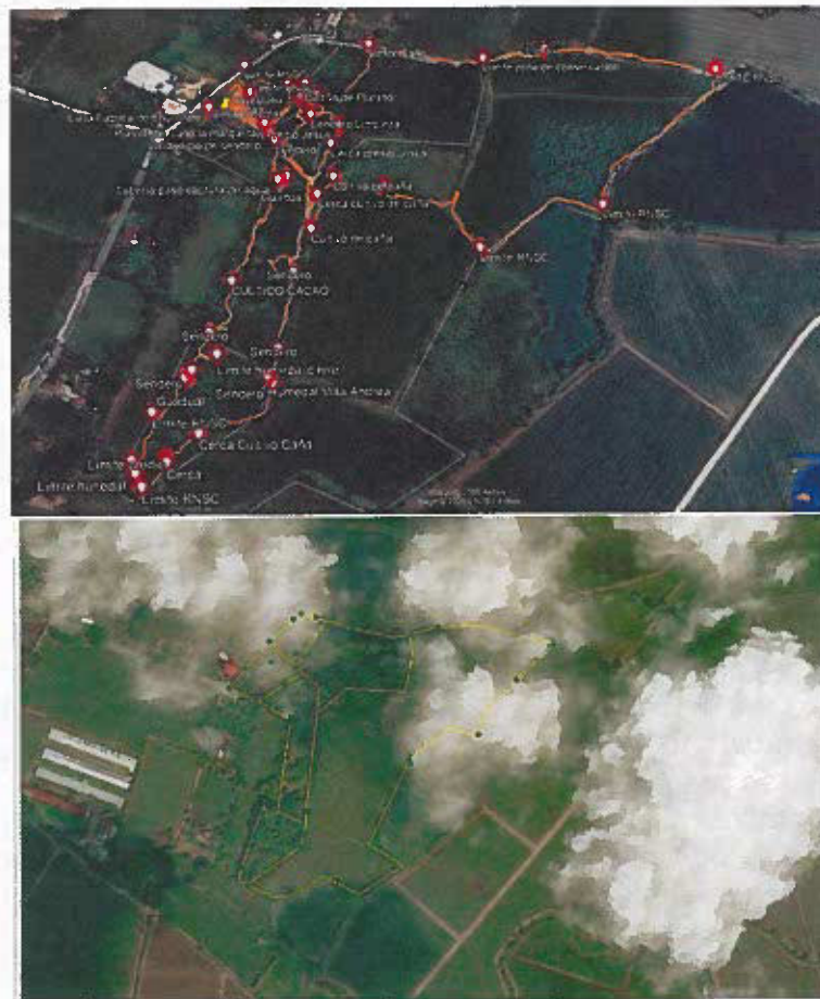
Figura 3. Recorrido y puntos georreferenciados en visita técnica de seguimiento realizada al Polígono actualizado de la Reserva Natural de la Sociedad Civil "VILLA ANDREA". Fuente: Visita técnica PNNC 2025.

El recorrido efectuado permitió verificar y delimitar con precisión el polígono de la RNSC. Como resultado del procesamiento de los datos recolectados en campo, se confirmó que el área del predio "Villa Andrea", identificado con FMI No. 378-30116 y que actualmente conforma la Reserva Natural de la Sociedad Civil "VILLA ANDREA", es de 7,8488 ha. Asimismo, se realizó la verificación del predio con FMI 378-259657, el cual se planea incorporar como parte de la reserva, con una extensión de 2,000 ha. Los datos del recorrido y los puntos georreferenciados se presentan a continuación (Figura 3).