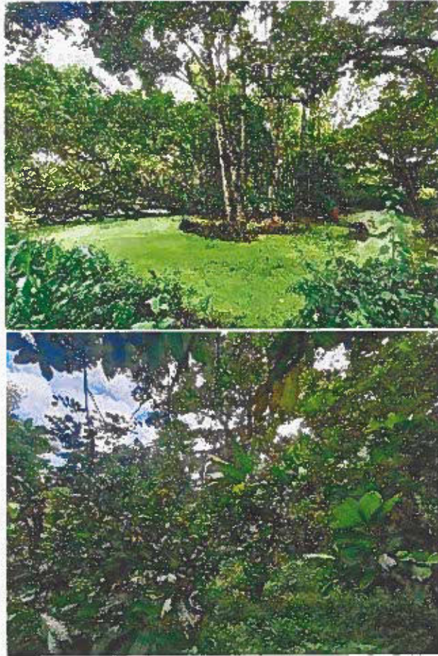
Imagen 2. Cobertura vegetal evidenciada durante la visita técnica de seguimiento, en el predio (Lote 2) propuesto para ser considerado como adicionalidad a la ya existente RNSC "VILLA ANDREA", las especies que predominan son los cultivos de cacao y plátano en arreglo agroforestal con poca presencia de especies típicas del Bosque Seco Tropical del Piedemonte Aluvial (BOCSEP).

POR MEDIO DE LA CUAL SE CANCELA EL REGISTRO DE LA RESERVA NATURAL DE LA SOCIEDAD CIVIL RNSC 047-13 "VILLA ANDREA" Y SE TOMAN OTRAS DETERMINACIONES