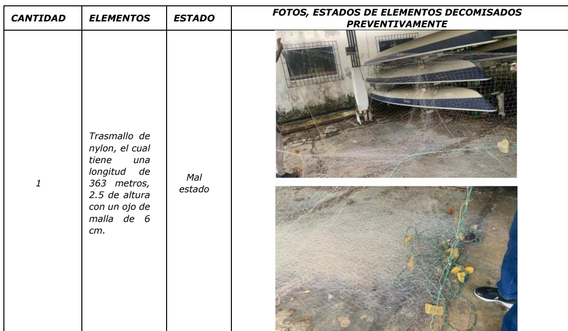
TABLA 15. ELEMENTO DECOMISADO PREVENTIVAMENTE – PROCESO SANCIONATORIO 060/2017

De acuerdo con el informe de estado actual 20246660006133 del arte de pesca tipo trasmallo decomisado en el sector de Isla Grande con el que se encontraba realizando pesca el señor Deivis Arzuza el 31 de marzo de 2018, se encuentra bajo custodia de Parques Nacionales Naturales de Colombia, el cual se encuentra en mal estado tabla 15.