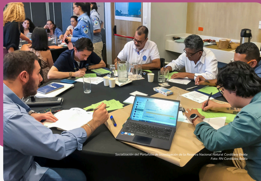
Socialización del Portafolio de Investigación de la Reserva Natural Cordillera Beata

Adicionalmente, fue aprobado el Plan de Manejo de la Reserva Natural Cordillera Beata, área que también socializó su portafolio de proyectos de investigación con universidades e instituciones, con el objetivo de fortalecer la cooperación científica y atraer nuevos aliados para su conservación.