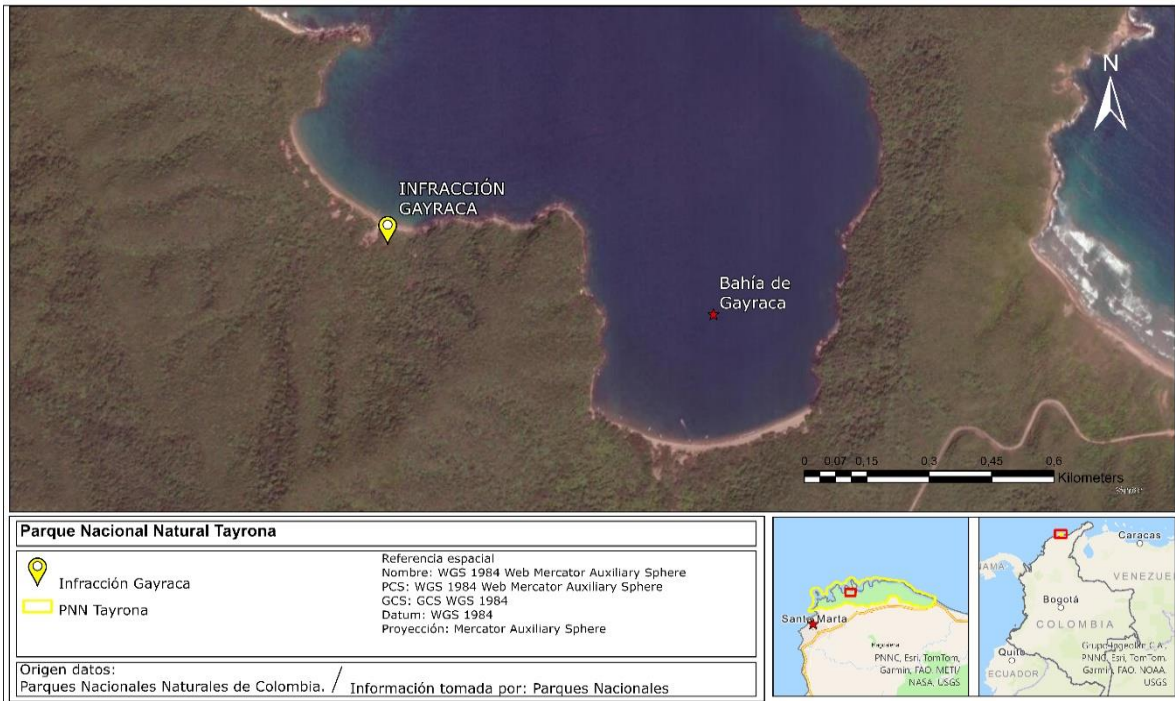
Mapa 1: ubicación de la presunta infracción, playas del Medio, sector de Gayraca, Parque Nacional Natural Tayrona.

Resolución No 20266720000125 DE 23-04-2026