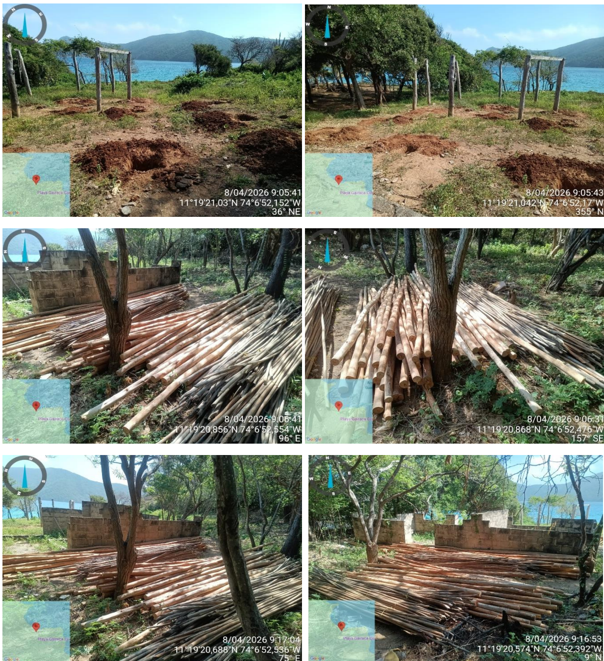
Imagen 1 de 6: varas de caña brava, listones de madera y huecos alineados.