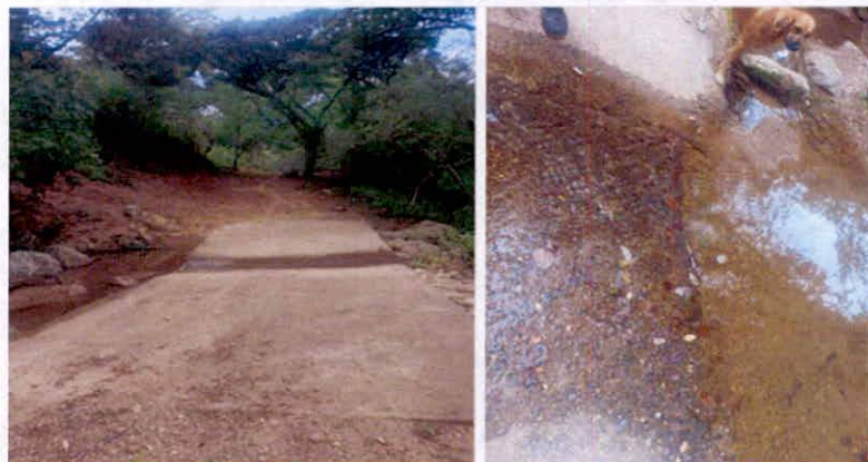
Imagen 2. Quebrada Jagualito.