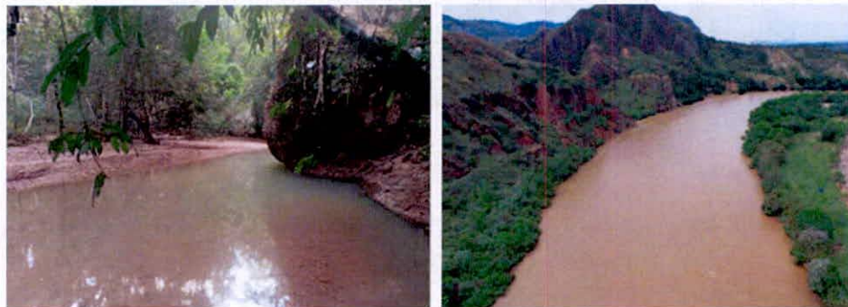
Imagen 5. Cuerpos de agua permanente, imagen superior derecha "Río Magdalena", superior izquierda e inferior izquierda "Quebrada El Achiote", inferior derecha "Quebrada Jagualito".