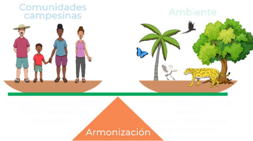
Ilustración 1 Armonización campesinado – Ambiente