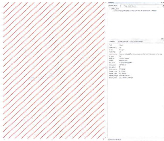
Figura 1. Traslape total del predio denominado "SIN DIRECCION SOL Y LUNA LT 2" inscrito bajo el folio de matrícula inmobiliaria No. 290-120167, en proceso de registro como RNSC, con OMEC "Nombre Cuenca Hidrográfica Río La Vieja, con Plan de Ordenación y Manejo registrada según la capa 7/7/2022.