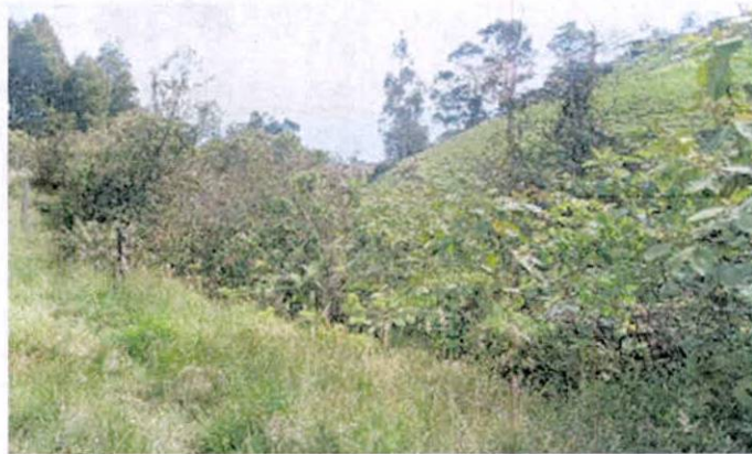
Figura 7. Zona de restauración que conforma la RNSC "ARRAYANES DE PACHINDO".

procesos iniciales e intermedios de sucesión y aún no alcanza la composición estructura y función propia del ecosistema.