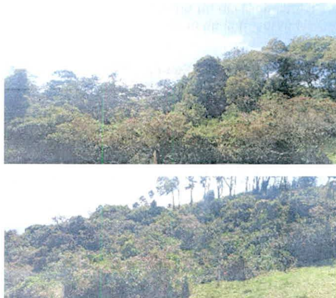
Figura 4: Evidencia de presencia de muestra de ecosistema natural del Predio "LOTE" identificado con FMI 240-184285, en la RNSC "ARRAYANES DE PANCHINDO".

Fuente: Visita técnica de seguimiento PNNC del 15 de noviembre de 2024.