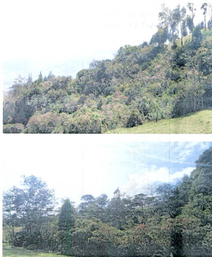
Figura 6. Zona de conservación que conforma la RNSC "ARRAYANES DE PANCHINDO".