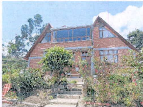
Figura 10. Zona de Uso intensivo e Infraestructura que conforma la RNSC "ARRAYANES DE PANCHINDO".