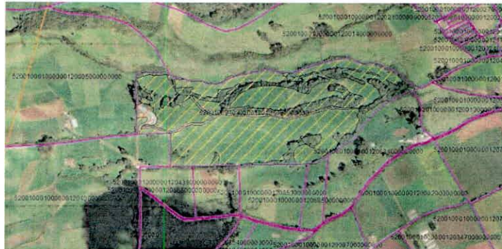
Figura 2. Verificación del polígono de la Reserva Natural de la Sociedad Civil "ARRAYANES DE PANCHINDO" con la capa catastral del IGAC.