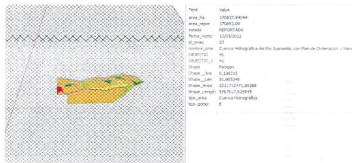
Figura 11. Traslape del predio denominado "LOTE" identificado con FMI 240-184285, con capa OMEC año 2023.

Fuente: Verificación cartográfica PNNC con OMEC año 2023.