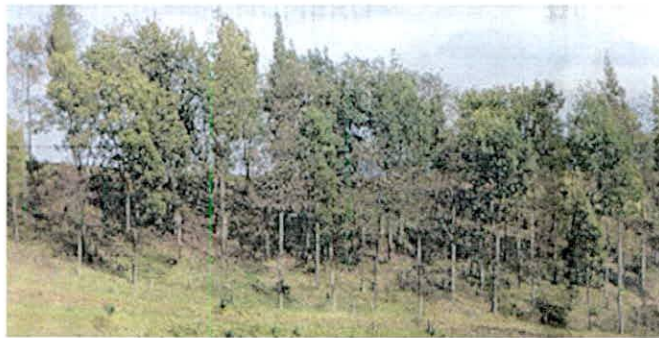
Figura 8. Zona de Amortiguación y Manejo Especial que conforma la RNSC "ARRAYANES DE PANCHINDO".