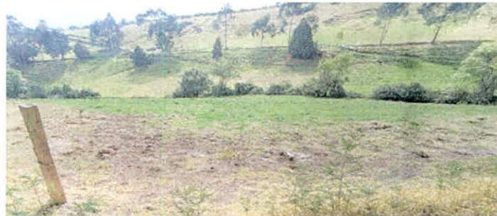
Figura 9. Zona de agrosistemas que conforma la RNSC "ARRAYANES DE PANCHINDO".

Esta zona corresponde al 9,9382 ha equivalentes al 73 % del área objeto de modificación. Se localiza en las partes bajas, con cobertura de pastos arbolados, donde se desarrollan actividades agropecuarias, principalmente enfocadas en la ganadería sostenible.