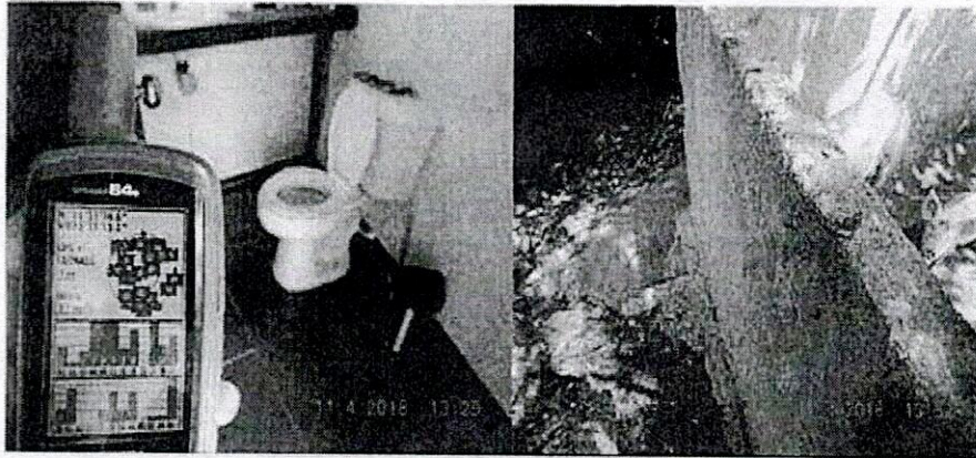
Figuras 9, 10. Presencia de baterías sanitarias, duchas, áreas de cocina y encerramiento de ganado porcino (cerdos).

Se evidenció la existencia de baterías sanitarias (baños y duchas), áreas de preparación de alimentos (cocinas), en los que se hace uso de aguas captadas en cuerpos de agua superficial próximos al predio donde funcionan las instalaciones (Figuras 9, 10). A partir de este hecho se determina la generación de vertimientos líquidos de aguas negras y grises, sobre el suelo del área protegida. Esta conducta se encuentra prohibida en las áreas protegidas del Sistema de Parques Nacionales Naturales, de acuerdo a lo dispuesto en el Decreto 622 de 1977 3 (Art. 30; Núm. 1 - El vertimiento, introducción, distribución, uso o abandono de sustancias tóxicas o contaminantes que puedan perturbar los ecosistemas o causar daños en ellos ).