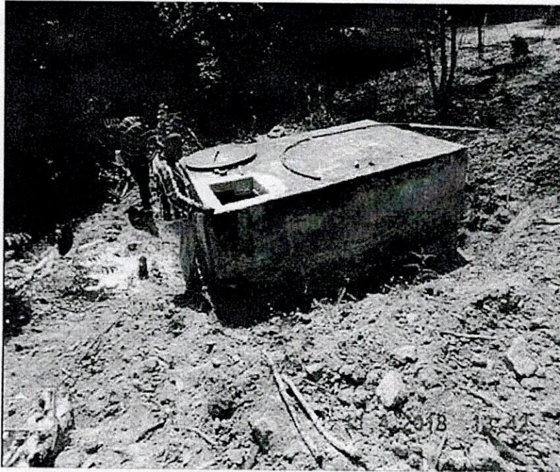
Figuras 18. Excavaciones en el suelo para la construcción de tanques de almacenamiento de agua en mampostería y cemento.

Se evidenció la realización de actividades de excavaciones profundas, en las que se realizó igualmente la remoción de toda cobertura vegetal e igualmente se aprecia en la foto, que tuvo que ser reconfigurado el suelo en los alrededores del tanque, con lo que se evidencia un cambio en la forma del suelo o geoforma, ocasionando una pérdida de microhábitats de las coberturas vegetales arbustivas que allí llegasen a existir e igualmente se aprecia en la fotografía (Figura 18), que la profundidad periférica de estas excavaciones es de aproximadamente 60 cm. Esta conducta se encuentra prohibida en las áreas protegidas del Sistema de Parques Nacionales Naturales, de acuerdo a lo dispuesto en el Decreto 622 de 1977 (Art. 30; Núm. 6 - Realizar excavaciones de cualquier índole, excepto cuando las autorice Parques Nacionales Naturales de Colombia por razones de orden técnico o científico).