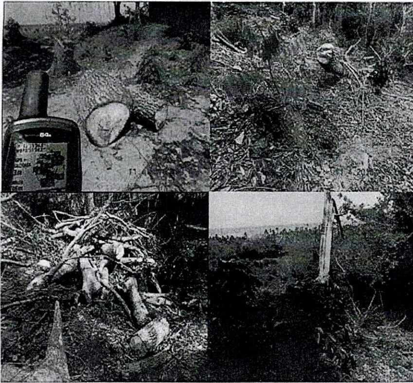
Figuras 14, 15, 16 y 17. Tala de árboles en varios puntos del predio.

Se evidenció la realización de actividades de tala (Figuras 14, 15, 16 y 17), que constituyen la pérdida de especímenes de flora de gran porte y que promueven procesos erosivos en el suelo, la pérdida de microhábitats de especies de aves, insectos, anfibios y otras especies asociadas a esta cobertura vegetal boscosa, la cual tardará un tiempo muy considerable de varios años en proveer individuos que sustenten los ecosistemas asociados a los mismos. Esta conducta se encuentra prohibida en las áreas protegidas del Sistema de Parques Nacionales Naturales, de acuerdo a lo dispuesto en el Decreto 622 de 1977 6 (Art. 30; Núm. 4 - Talar, socolar, entresacar o efectuar rocerías).