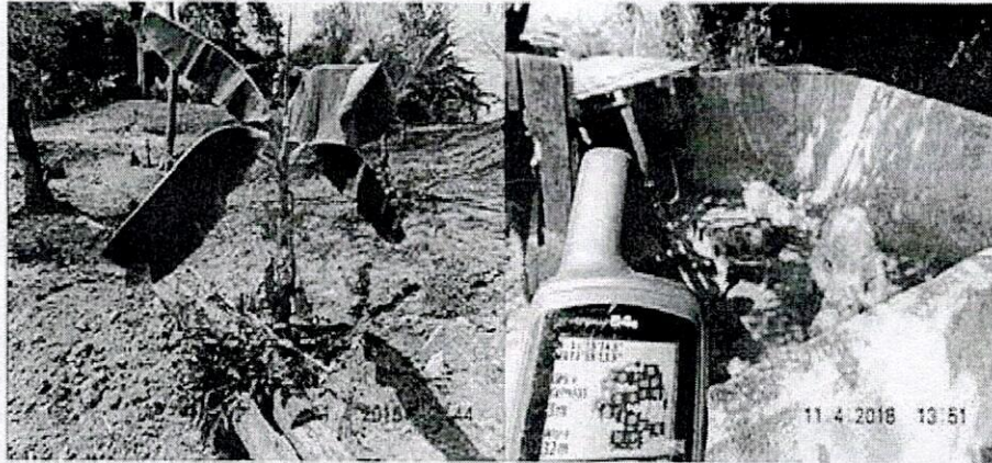
Figuras 12 y 13. Introducción de animales (porcinos), árboles frutales no nativos (exóticos) del área protegida.

Se evidenció la presencia de especies de animales exóticos como la presencia de tres (03) cerdos (Figura 13), así como de árboles frutales como el plátano - Musa spp - (Figura 12), con los cuales se generan riesgos de enfermedades zoonóticas, transmisibles a especies de fauna silvestre protegida y seres humanos, que pueden contraer enfermedades por la presencia de animales de granja y que afectan el hábitat y la diversidad biológica de las especies endémicas o nativas que habitan ese espacio y son desplazadas por estas, que llega a ocupar su hábitat (Figura 12). Esta conducta se encuentra prohibida en las áreas protegidas del Sistema de Parques Nacionales Naturales, de acuerdo a lo dispuesto en el Decreto 622 de 1977 5 (Art. 30; Núm. 12 - Introducir transitoria o permanentemente animales, semillas, flores o propágulos de cualquier especie ).