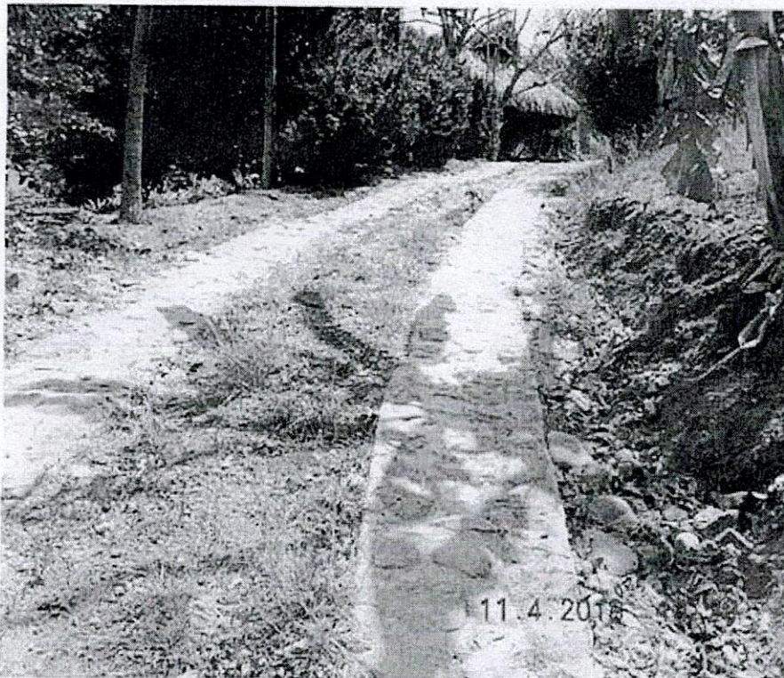
Figura 1. Ingreso al predio denominado "La Brigada" para visita a las construcciones presentes en el predio de la diligencia (Miércoles, 11 de abril de 2018)