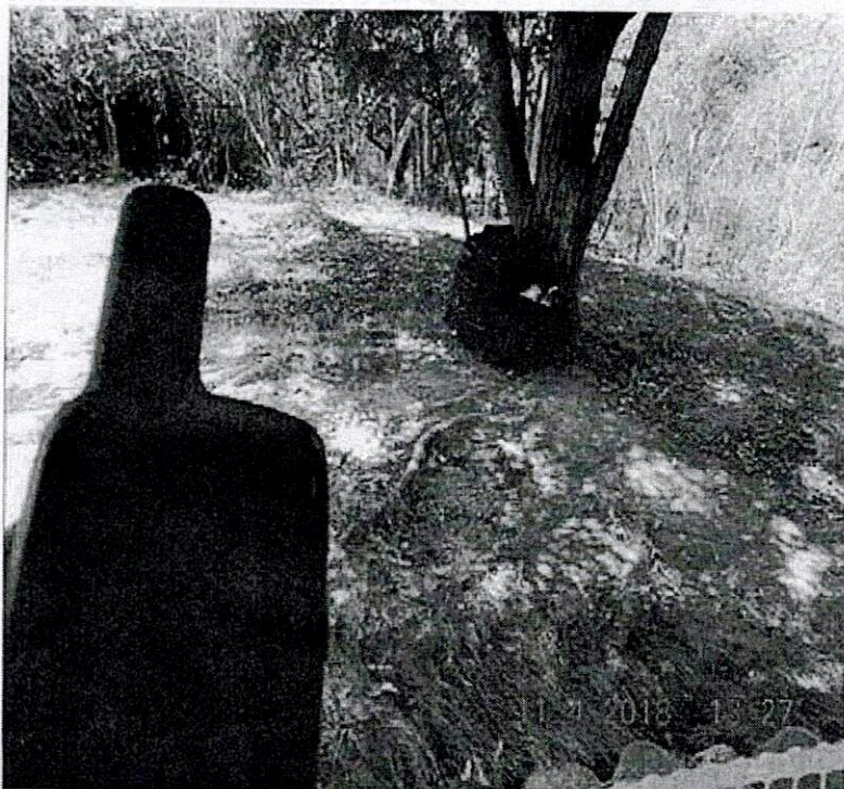
Figura 11. Generación y depósito de residuos sólidos ordinarios.

Se evidenció la presencia y manejo inadecuado de residuos sólidos (residuos ordinarios, figura 11), los cuales se manipulan depositan al interior del área protegida y pueden conllevar a la proliferación de vectores (especies animales transmisoras de enfermedades), contaminación de suelos y cuerpos de agua, contaminación del aire (olores ofensivos), entre otros impactos asociados a esta conducta prohibida y que se realizan sobre una zona de recuperación natural, que no admite intervención humana de esta naturaleza. Esta conducta se encuentra prohibida en las áreas protegidas del Sistema de Parques Nacionales Naturales, de acuerdo a lo dispuesto en el Decreto 622 de 1977 4 (Art. 30; Núm. 14 - Arrojar o depositar basuras, desechos o residuos en lugares no habilitados para ello o incinerarlos), además de su inadecuada gestión (generación, clasificación, manipulación, almacenamiento, disposición y tratamiento), de acuerdo a la normatividad ambiental relacionada con la Gestión Integral de Residuos Sólidos.