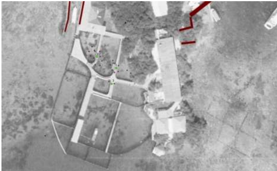
Imagen 4. Vista específica de encierros y pasarelas elevadas sobre fotografía aérea IGAC 1993

Resolución No *20266530000015* DE 13-01-2026