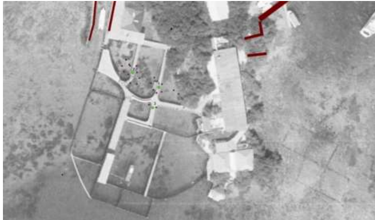
Imagen 4. Vista específica de encierros y pasarelas elevadas sobre fotografía aérea IGAC 1993

Y en la imagen 4, se visualiza una vista más específica en fotografía aérea, la existencia de los encierros y pasarelas elevadas