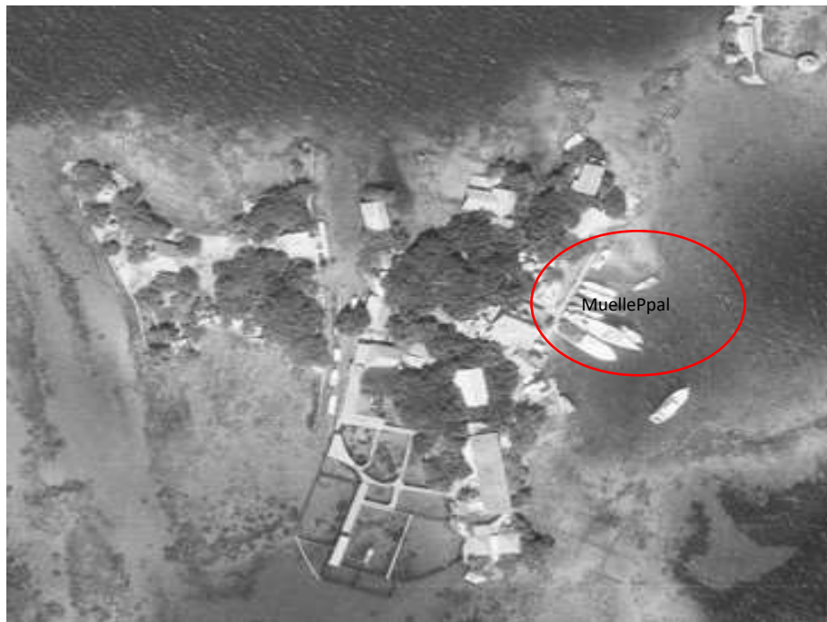
Imagen 3. Vista general de la Isla San Martín de Pajarales sobre fotografía área IGAC 1993 – Vuelo C2526-150