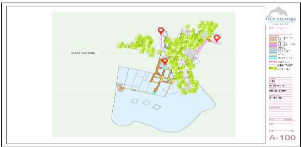
(Figura 2. Plano general de la infraestructura a reparar)

Resolución No *20266530000015* DE 13-01-2026