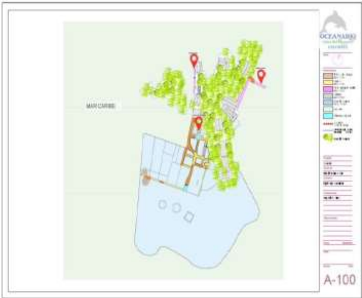
Imagen 2. Pantallazo esquema gráfico del peticionario para labores de reparación de infraestructura existente

Así también, el solicitante adjunta en su información documental un esquema gráfico (Ver imagen 2), en el que reitera que las actividades del trámite de reparación, reposición y mejora de las obras solicitadas, contempla únicamente la infraestructura existente, sin generar ampliaciones, ni modificaciones estructurales.