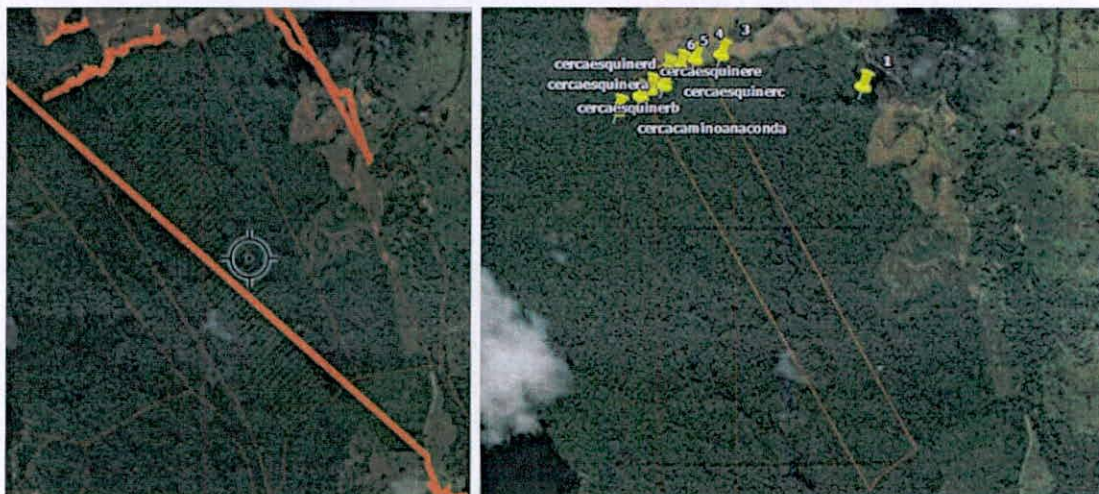
Figura 1. Recorrido realizado por los linderos de la RNSC 135-24 PIEDRA ALTA (Imagen izquierda) y puntos georreferenciados mediante Equipo GNSS procesamiento tipo NTRIP (Imagen derecha), donde se encuentra el recorrido realizado con la aplicación Avenza MAPS y equipos GNSS.

Sin embargo, al momento de llegar a los linderos mencionados por vecinos y anteriores propietarios, se encontró que no existía claridad de donde limitaban los predios de estas personas con los de la RNSC "PIEDRA ALTA" (Imagen 1), esto debido a que no existe cerca divisoria.