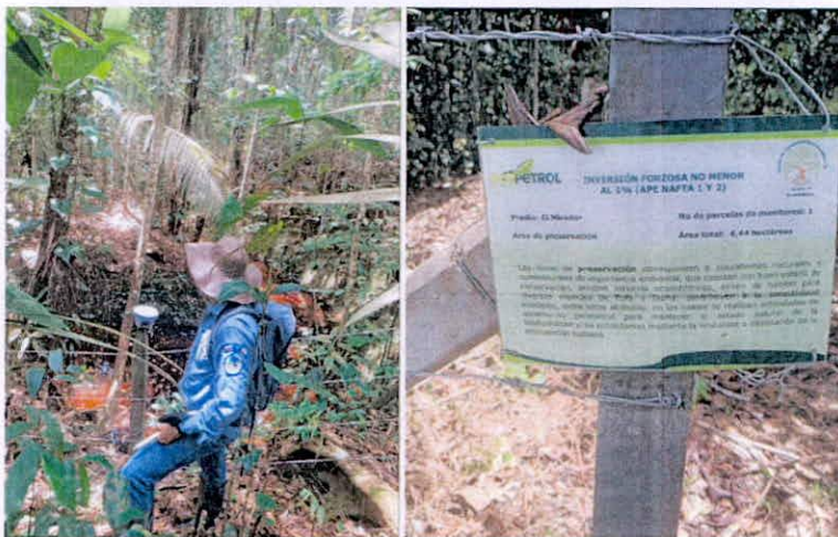
Imagen 1. Cerca de alambre de puas dentro del polígono del predio denominado "Finca La Anaconda", el cual encierra un polígono que pertenece al predio denominado "El Mirador", a cargo de ECOPETROL.

denominado "El Mirador" y no al predio objeto de visita técnica "Finca La Anaconda" (Imagen 1 y 2).