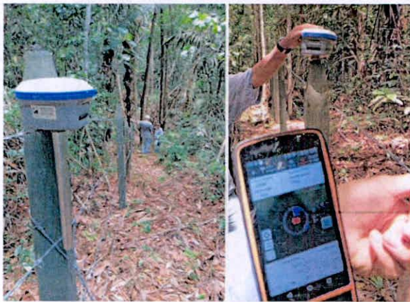
Imagen 2. Toma de puntos GNSS y con APP Avenza MAPS, en arcifinios y cerca de alambre de puas del polígono del predio denominado "El mirador", a cargo de ECOPETROL.