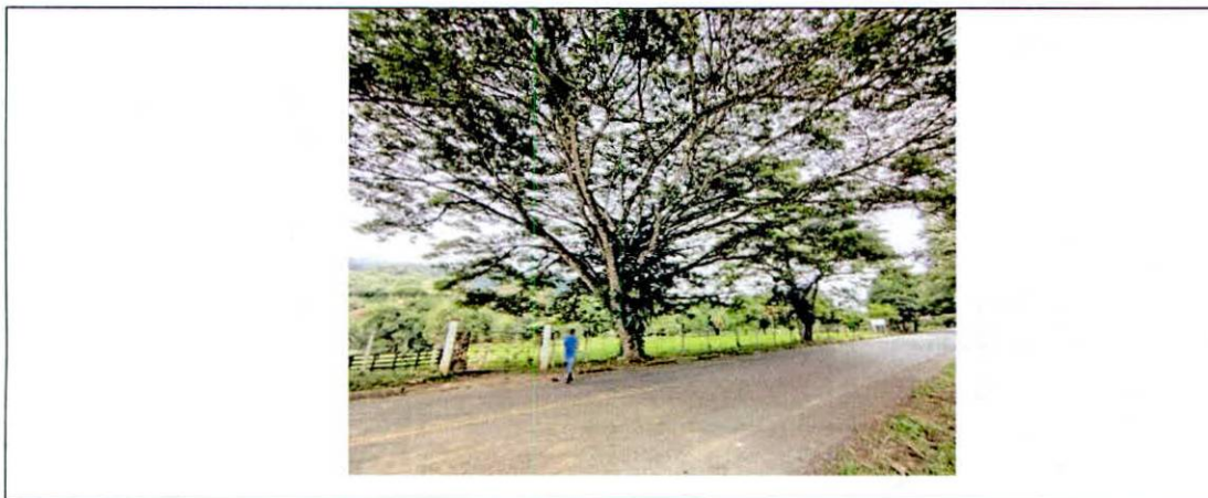
Figura 3. Potrero, árboles y plantas presentes en la parte coincidente del predio "FINCA VILLA MARIA".

POR MEDIO DE LA CUAL SE NIEGA EL REGISTRO COMO RESERVA NATURAL DE LA SOCIEDAD CIVIL RNSC 084-24 "FINCA VILLA MARÍA"