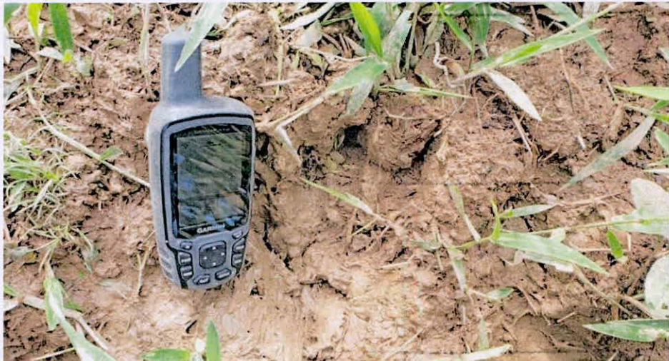
Figura 3. Rastro de Yulo, observado durante visita técnica a la RNSC 098-23 ROMORAL.

POR MEDIO DE LA CUAL SE REGISTRA LA RESERVA NATURAL DE LA SOCIEDAD CIVIL RNSC 098-23 "ROMORAL"