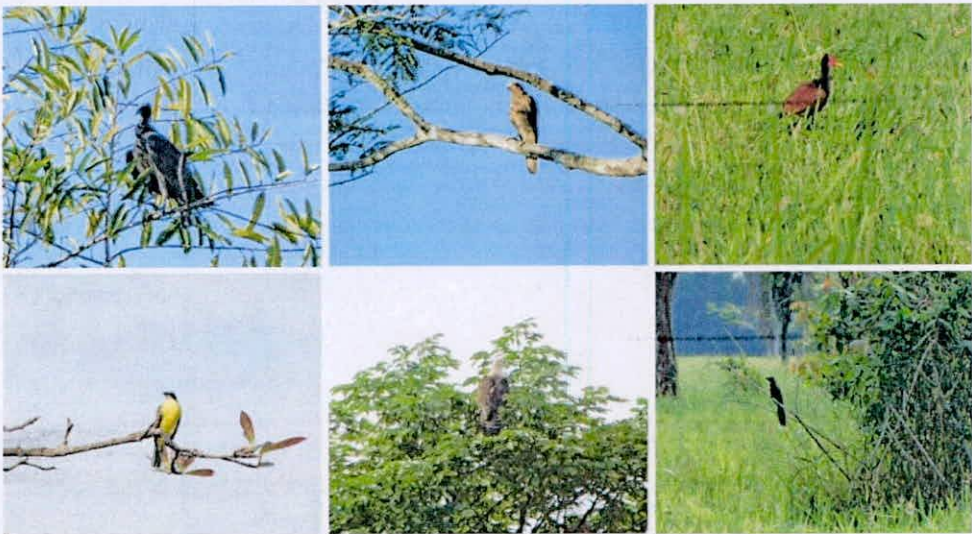
Figura 2. Aves observadas durante visita técnica a la RNSC 098-23 ROMORAL.

Por otra parte, Durante la visita técnica, se observaron diferentes especies de aves, dentro de las que se encuentran: garrapateros, goleros, atrapamoscas, chamonés, jacanas y alcaravanes (Figura 2).