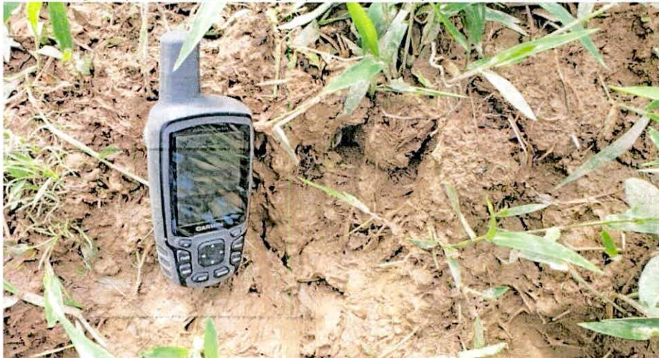
Figura 3. Rastro de Yulo, observado durante visita técnica a la RNSC 098-23 ROMORAL.

De acuerdo con el levantamiento faunístico citado en la reseña descriptiva del predio "Sin Dirección Romoral", la presencia de los mamíferos medianos y grandes se registró mediante el contacto visual directo y el análisis y búsqueda de rastros como huellas, heces, comederos y/o madrigueras, efectuando recorridos a lo largo de las áreas evaluadas. Adicionalmente se empleó la ayuda de 14 cámaras trampa. Para este grupo se registraron 26 especies distribuidas en 6 órdenes y 14 familias, siendo murciélagos y roedores los grupos con mayor número de especies reportadas (