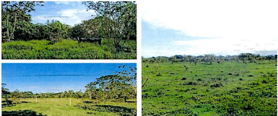
Figura 8. Zona de Agrosistemas de la RNSC 098-23 "ROMORAL".

La Zona de Agrosistemas presenta una extensión de 33,5552 ha, las cuales equivalen al 43,54% del total del área objeto de registro. En esta zona se desarrollan las actividades productivas del predio y está conformada por zonas de potreros con árboles aislados, y zonas de rastrojo que serán transformadas a sistemas silvopastoriles. Actualmente el ganado que se maneja en este sistema corresponde en su mayoría a ganado de ceba, aunque también se encuentra ganado de ordeño en descanso (Figura 8).