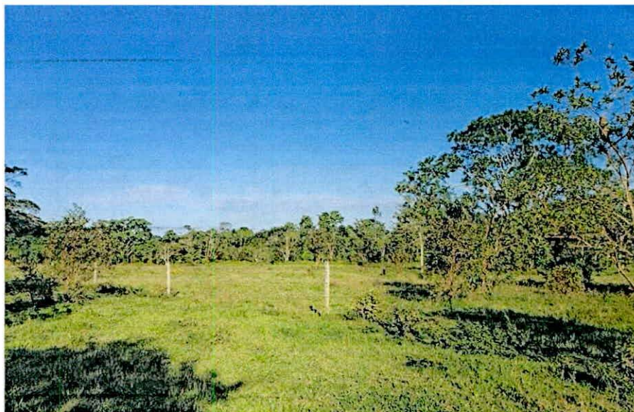
Figura 1. Vista General RNSC 098-23 "ROMORAL".

POR MEDIO DE LA CUAL SE REGISTRA LA RESERVA NATURAL DE LA SOCIEDAD CIVIL RNSC 098-23 "ROMORAL"