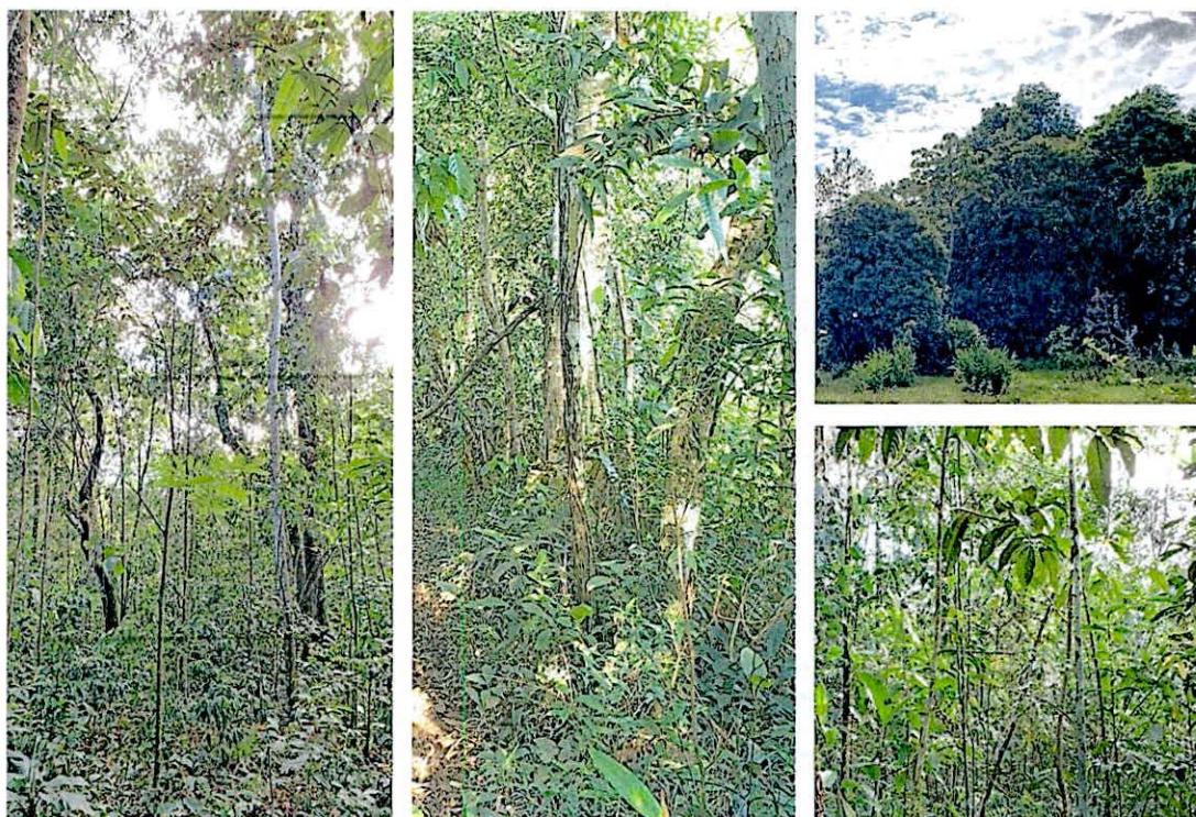
Figura 5. Zona de Conservación de la RNSC 098-23 "ROMORAL".

El área de conservación comprende 8,4968 ha, equivalente al 11,03 % del total del área bajo registro. De acuerdo con lo evidenciado durante la visita técnica y lo presentado por el usuario en la solicitud de registro, esta zona está conformada en su mayoría por bosque secundario en buen estado de consolidación correspondiente al Bioma Bosque Húmedo Tropical (bh-T) y bosques de galería, inmersos en una matriz heterogénea de potreros para ganadería. El bosque corresponde a bosques secundarios con diferentes estados de desarrollo, al igual que zonas en procesos iniciales de regeneración natural. En las zonas de bosque maduro se identifican tres estratos verticales bien definidos, árboles con alturas superiores a 20m y DAP > 32cm, así como buena conectividad de dosel. En general muestra buen estado de conservación, manteniendo en gran medida la composición, estructura y función propias de este tipo de ecosistema (Figura 5).