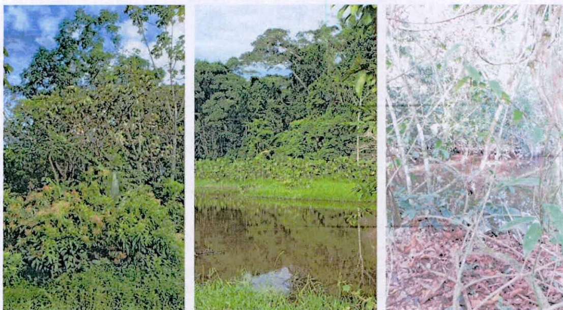
Figura 6. Zona de Amortiguación y Manejo Especial de la RNSC 098-23 "ROMORAL".

POR MEDIO DE LA CUAL SE REGISTRA LA RESERVA NATURAL DE LA SOCIEDAD CIVIL RNSC 098-23 "ROMORAL"