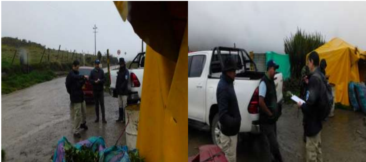
Figura 6 y 7. Entrega de los dos (02) bultos de árnica por parte del presunto infractor a funcionarios del PNN Sumapaz.