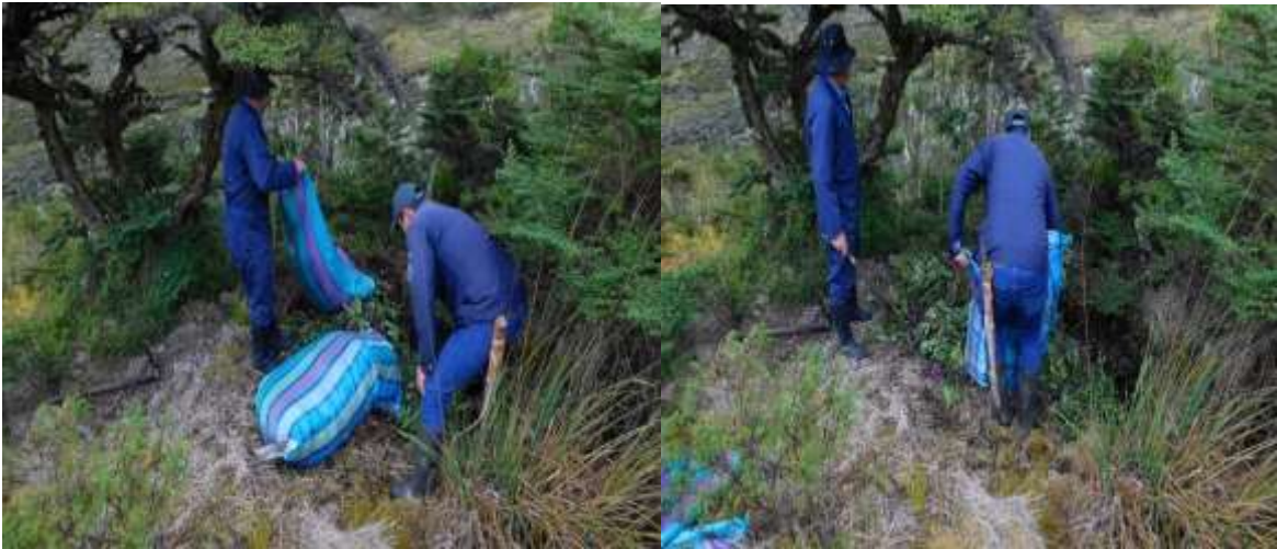
Figura 8 y 9. Vista de la disposición final mediante enterramiento de los dos (02) bultos aprehendidos de árnica ( Senecio formosus ) por funcionarios del PNN Sumapaz.