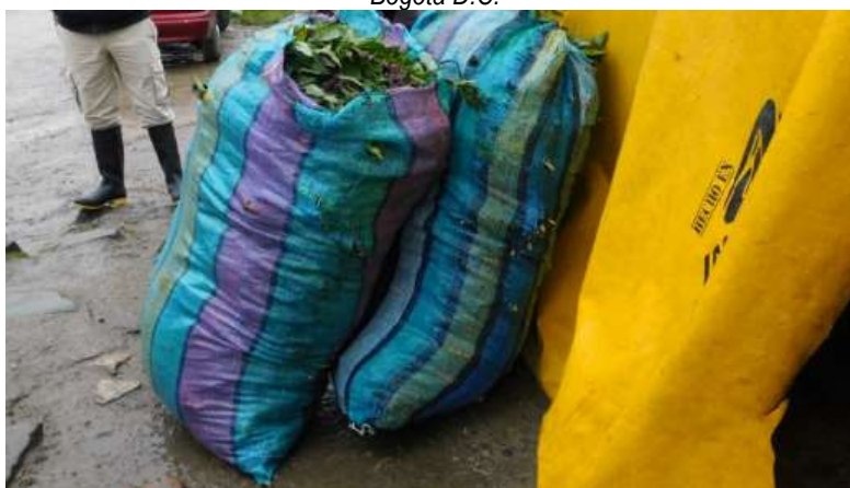
Figura 3. Vista de los Dos (02) bultos de árnica fresca ( Senecio formosus ) que encontró el Ejército Nacional al interior del vehículo de placas CIL 285 dentro del PNN Sumapaz.