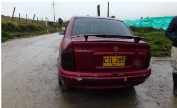
Figura 2. Vehículo que transitaba al interior del PNN Sumapaz, en la vereda Santa Rosa de la Localidad de Sumapaz, Bogotá D.C.

A continuación, se presentan imágenes de los hechos: