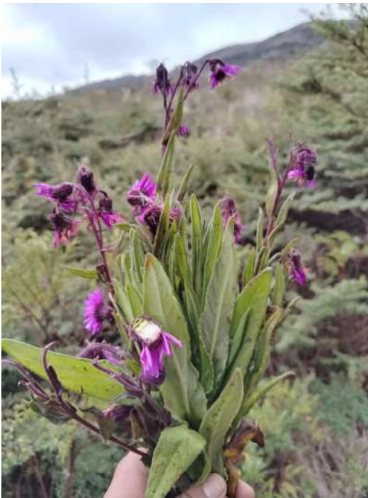
Figura 5. Vista a detalle de las plantas de árnica encontradas dentro del vehículo de placas CIL 285 en el PNN Sumapaz.