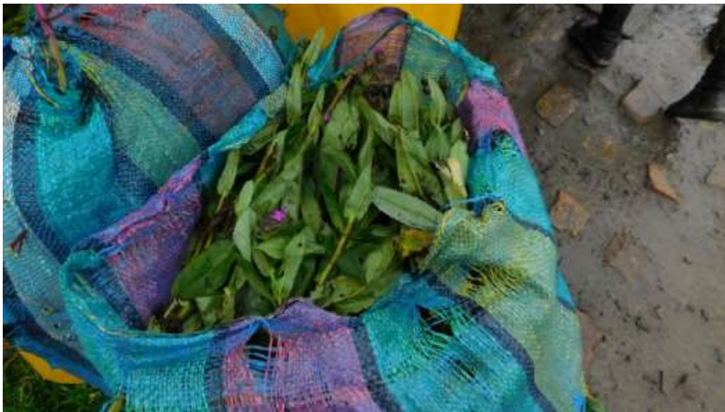
Figura 4. Vista de Árnica ( Senecio formosus ) que encontró el Ejército Nacional al interior del vehículo de placas CIL 285 dentro del PNN Sumapaz.

PARQUES NACIONALES NATURALES DE COLOMBIA