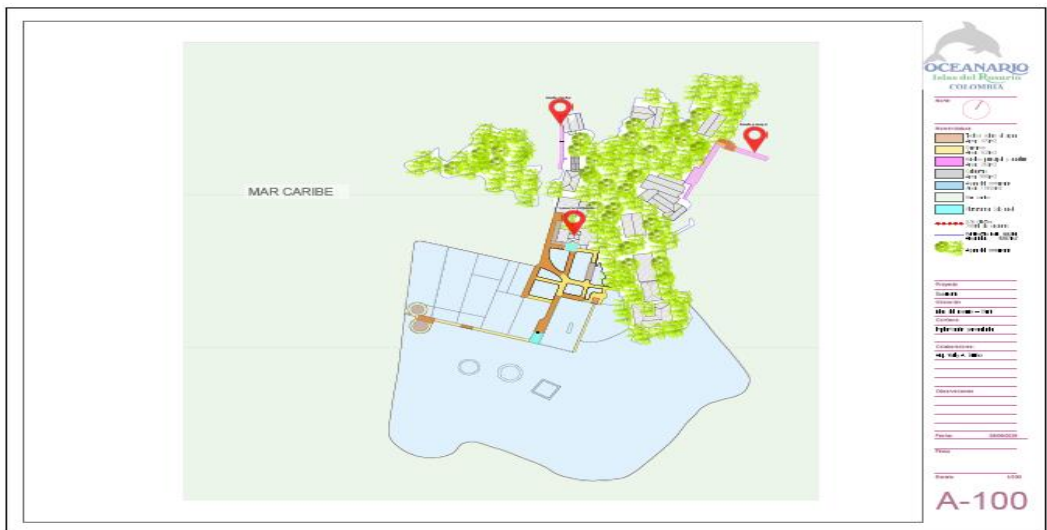
(Figura 2. Plano general de la infraestructura a reparar)

ARTÍCULO SEGUNDO. - Enviar el expediente contentivo de la solicitud objeto del presente acto administrativo, al Jefe del PNN Corales del Rosario y de San Bernardo, para que emita concepto técnico. De igual forma, en caso de considerar viable el proyecto, realice las liquidaciones por el servicio de seguimiento de conformidad con lo reglado en la resolución No. 0321 del 10 de agosto de 2015 modificada por la resolución No. 136 de 09 de abril de 2018.