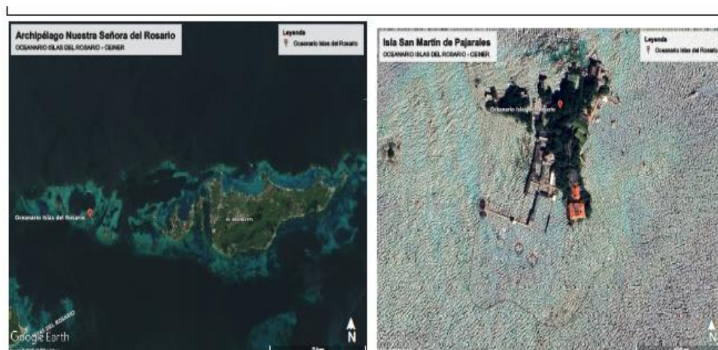
(Figura 1. Localización del Oceanario Islas del Rosario – CEINER, Isla San Martín de Pajarales, Archipiélago Nuestra Señora del Rosario).