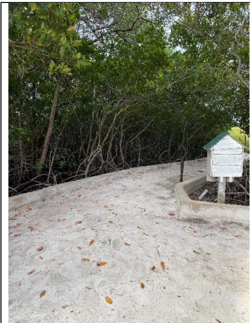
Fotografía No. 5 Estructura terminada con capa superior en concreto y delimitada por un bordillo en concreto. Del informe de campo, PNNCRSB, 2025.