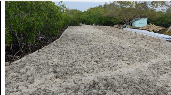
Fotografía No. 3 Proceso de construcción ya adecuación del terreno para el pasillo / camino / área, evidenciando el relleno de estructura con arena de playa y pastos marinos.