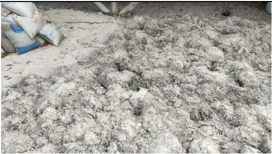
Fotografía No. 4 Restos de Pastos Marinos usados para el relleno del área.