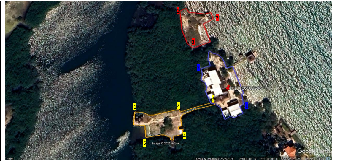
Imagen No. 8 Puntos georreferenciados en campo (visita de campo 12/03/2025) y con la información geográfica en línea ( Google Earth, 2024 ) se identifica la zona afectada en la Laguna Salsipuedes, Isla Tintipán, Archipiélago de San Bernardo, PNN Los Corales del Rosario y San Bernardo.

El polígono identificado cuenta con un área total de 3.329 m 2 y se ubica como se muestra en la siguiente imagen: