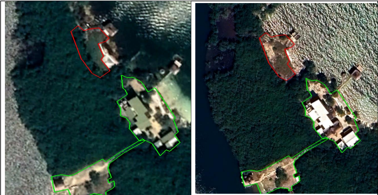
Imagen No. 8 El polígono de color rojo pretende ilustrar el Área afectada por tala de Mangle. La imagen de la izquierda es la imagen satelital del año 2018 y la de la derecha es del año 2024. Con este análisis es posible definir que el área total de tala de mangle es igual a 632 m 2 (polígono de color rojo).

Con las imágenes mostradas anteriormente, tomadas de las fotografías aéreas cargadas en la web (Google Earth) correspondiente a las vigencias 2010, 2014, 2018 y 2024, se evidencia que si bien desde el año 2014, el ecosistema no cuenta con una cobertura densa y continua de bosque por las estructuras construidas e identificadas tanto en campo como en las imágenes, se aprecia claramente la remoción de bosque de manglar en un área de aproximadamente igual a 632 m 2 (identificado con el polígono de color rojo en la Imagen No. 8). Esta pérdida de cobertura de manglar indica un proceso de tala reciente, que conforme lo evidenciado en campo el día 12 de marzo de 2025 se realizó la construcción de una nueva estructura. La remoción de esta cobertura vegetal incrementa la vulnerabilidad de la zona frente a eventos extremos, reduce la capacidad de resiliencia ambiental y plantea la necesidad urgente de establecer medidas de restauración y control, teniendo en cuenta las condiciones actuales de intervención que presenta el ecosistema.