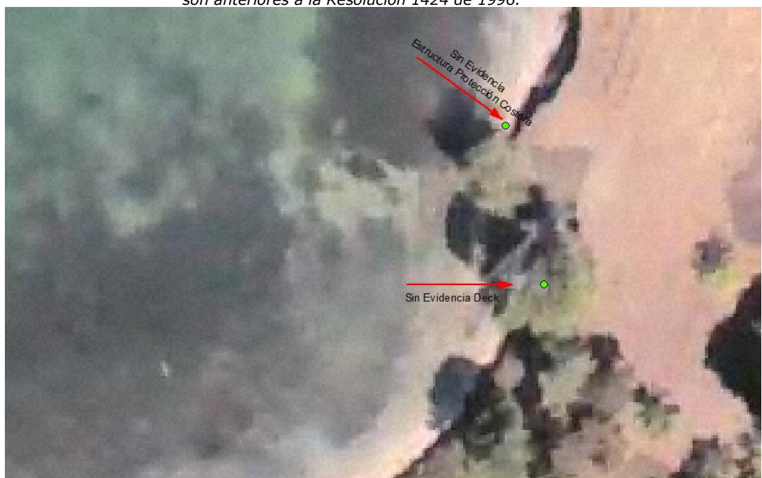
— Figura 2. imagen satelital WW2, 2007. No se evidencia estructura de protección costera y los dos Deck.