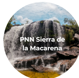
PNN Sierra de la Macarena

A través de la campaña #5Datos , compartimos información sobre las áreas protegidas .