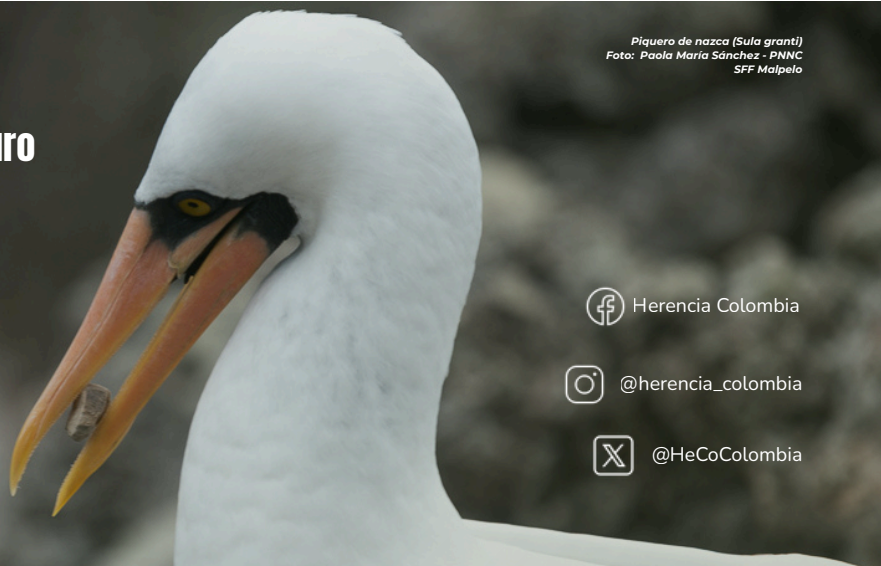
Piquero de nazca ( Sula granti )