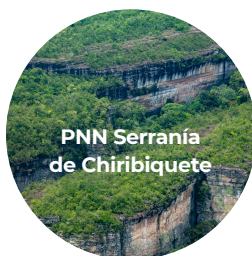
PNN Serranía de Chiribiquete