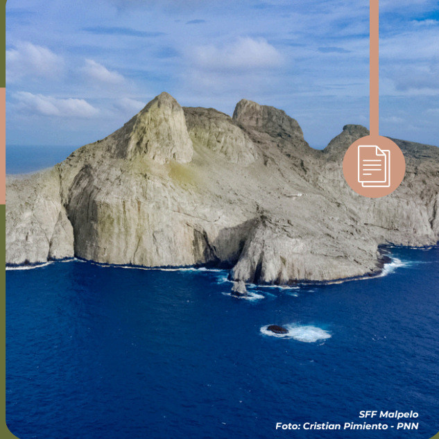
SFF Malpelo

Con la Universidad del Valle , se firmó un subacuerdo para capacitar a los equipos de Áreas Marinas Protegidas en el uso de sensores remotos , fortaleciendo el monitoreo de condiciones climáticas y su relación con la biodiversidad .