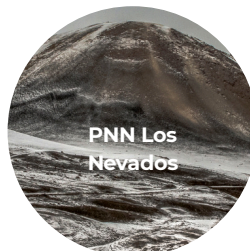
PNN Los Nevados