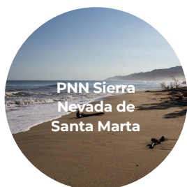
PNN Sierra Nevada de Santa Marta