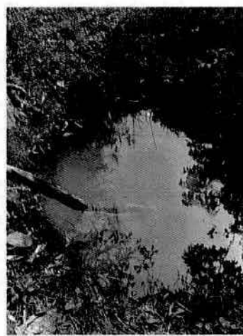
Imágenes Nacimiento Quebrada La Vaca