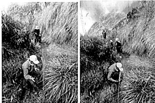
Imágenes del aforo, anterior al punto propuesto para la captación