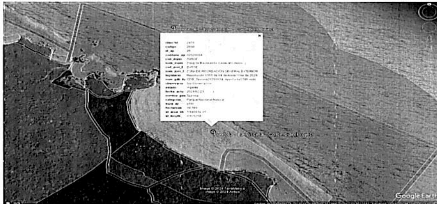
Punto 3. Sitio ubicado en La Piscina al interior de una zona de Recreación General Exterior del PNN Tayrona.