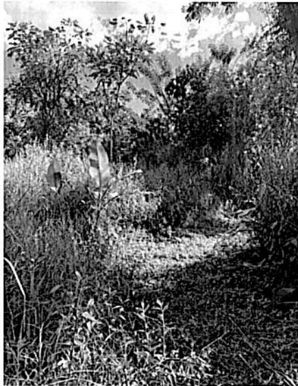
Imagen 11. Zona de Restauración RNSC "BOSQUE KAUKITÁ".

POR MEDIO DE LA CUAL SE REGISTRA LA RESERVA NATURAL DE LA SOCIEDAD CIVIL RNSC 251-23 "BOSQUE KAUKITÁ"