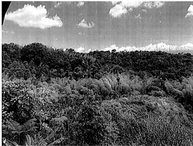
Imagen 1. Muestra ecosistémica RNSC 251-23 "BOSQUE KAUKITÁ".