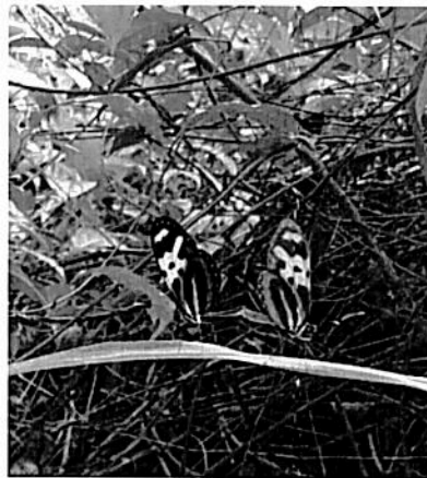
Imagen 8. Mariposas presentes en la RNSC "BOSQUE KAUKITÁ".

De acuerdo a la información suministrada por la propietaria se han presenciado más de 8 especies de mamíferos entre ellos la nutria Lontra longicaudis que está reportada como vulnerable por el SIB (Sistema de Información Sobre Biodiversidad), el mono Aullador ( Alouatta seniculus ), mono Maicero ( Cebus capucinus ) y se ha logrado el avistamiento de al menos 91 especies de aves pertenecientes a 35 familias.