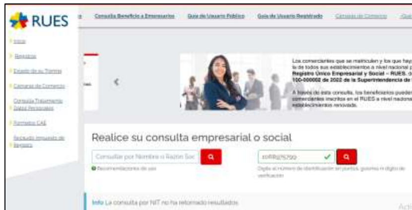
Imagen 4. Consulta en la página web del RUES

Los infractores no están registrados en la gran central de información empresarial de Colombia concentrada en el RUES, administrado por las Cámaras de Comercio del país.