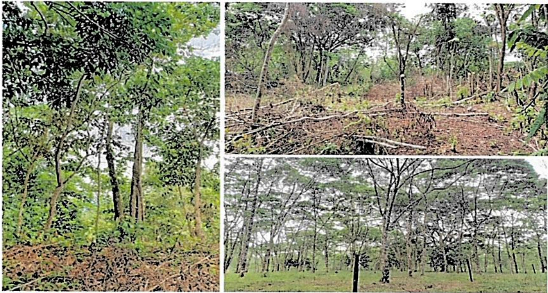
Figura 4. Bosques socolados en el predio " Sin Dirección. Hoy El Porvenir " identificado con FMI 420-19907, en el área propuesta por el usuario como zona de conservación. Fuente: visita técnica PNNC 20 de octubre de 2023