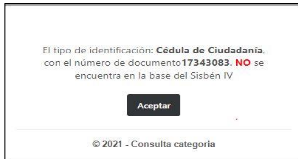
Figura 8 , registro del presunto infractor en la base de datos del Sisben.

Resolución No 2024653000065 DE 30-08-2024