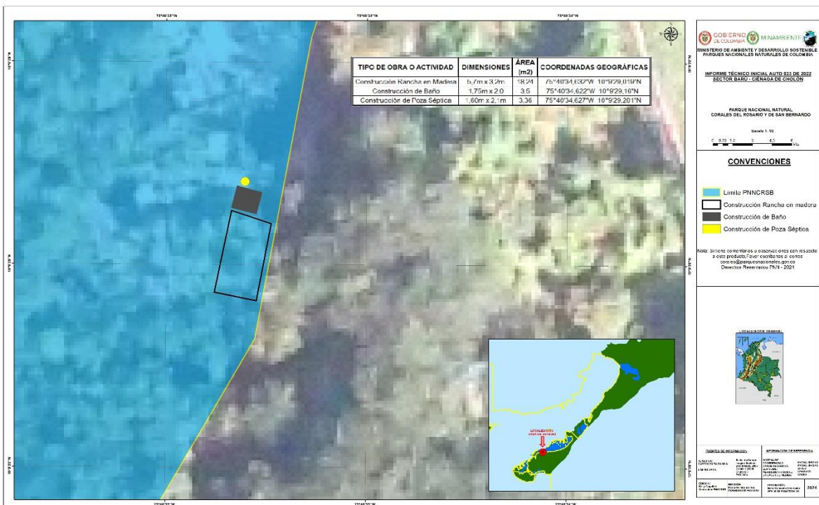
Figura N° 2. Levantamiento estado actual infraestructura en jurisdicción del PNNCRSB

— Una construcción de un pozo séptico contiguo al baño, también reportado en 2019 con dimensiones de 1.60 por 2.10 metros y techo de palma que ocupan un área de 3.36 mts 2 . En coordenadas geográficas: 75°40'34.567"W y 10°9'29.243"N.