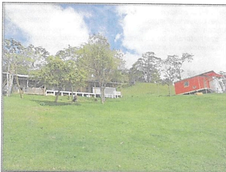
Figura 6. Zona de Uso Intensivo e Infraestructura de la RNSC "PALACEA".

Esta zona corresponde a 1,9030 ha equivalentes al 18,2% del área objeto de registro. Esta zona está conformada por las vías de acceso, el área de construcciones para la habitación permanente, el corral, el gallinero. Adicionalmente, en esta zona se va a construir una eco aldea (Figura 6).