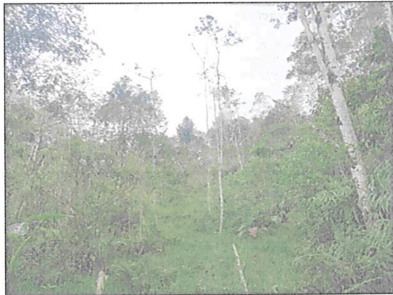
Figura 3. Zona de Amortiguación y Manejo Especial de la RNSC "PALACEA".