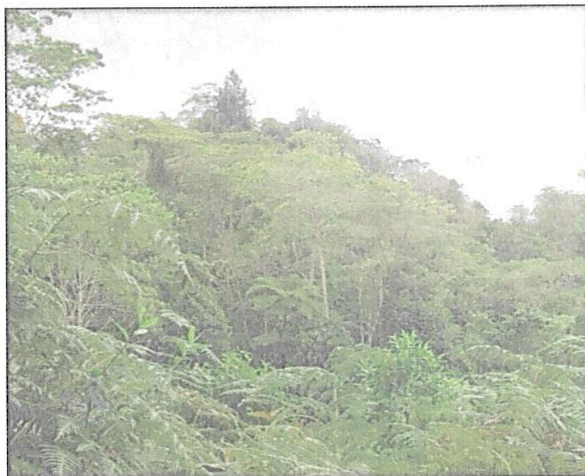
Figura 4. Zona de Restauración de la RNSC "PALACEA". Fuente: Visita Técnica realizada por Grupo de Trámites y Evaluación Ambiental – GTEA el 16 de noviembre de 2023.

Esta zona corresponde a 3,3005 ha equivalentes al 31,6% del área objeto de registro. En ésta se está realizando restauración pasiva, la cual se encuentra en estado inicial, los dueños anteriores tenían ganado, sin embargo en la actualidad esos potreros han venido transformándose y se puede apreciar una gran cantidad de helechos y especies colonizadoras típicas de primeros estadios de sucesión. Esta zona se encuentra aledaña a la zona de conservación (Figura 4).