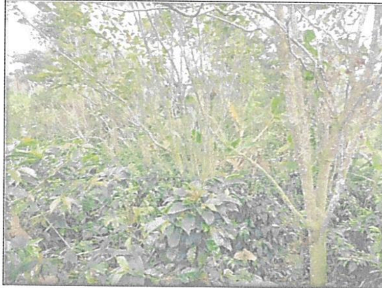
Figura 5. Zona de Agrosistemas de la RNSC "PALACEA".

Esta zona corresponde a 0,0390 ha equivalentes al 0,4% del área objeto de registro. Es una zona pequeña, donde hay un cultivo de café y plátano (Figura 5).