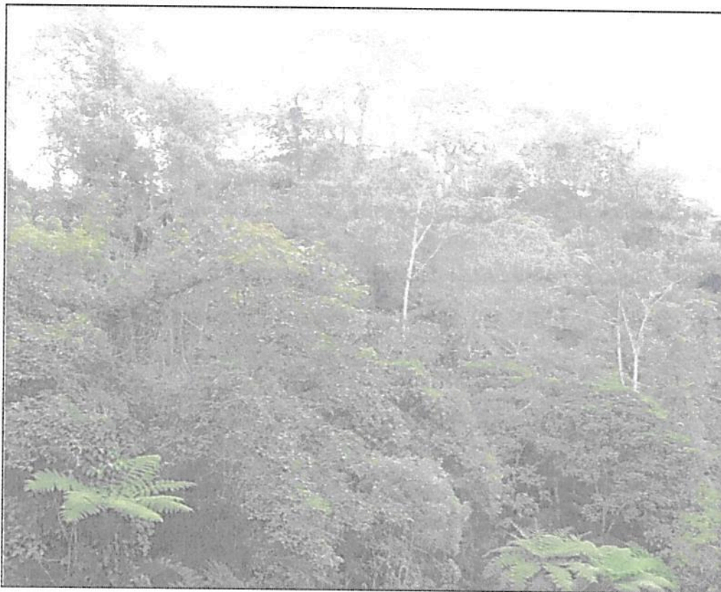
Figura 1. Muestra de ecosistema natural presente de Bosque Muy Húmedo Montano en los predios "Lote Palacea" FMI No. 157-109957 y Lote #4 Pandora FMI 157-109958 que conforman la RNSC 207-223 "PALACEA".

El predio presenta un ecosistema natural de Bosque Muy Húmedo Montano (Figura 1). Estos bosques se encuentran entre los 1000 y 2400 m de altitud y temperatura media anual entre 22-24°C y 14-15°C. Las zonas altas de este bosque, son bosques densos de tierra firme con árboles que tienen una altura de dosel superior a los 20 m y un estrato continuo, donde la cobertura arbórea representa el 70% del área total de estas zonas. Los bosques riparios presentes, son bosques que se encuentran en las márgenes de los cuerpos de agua presentes en la reserva