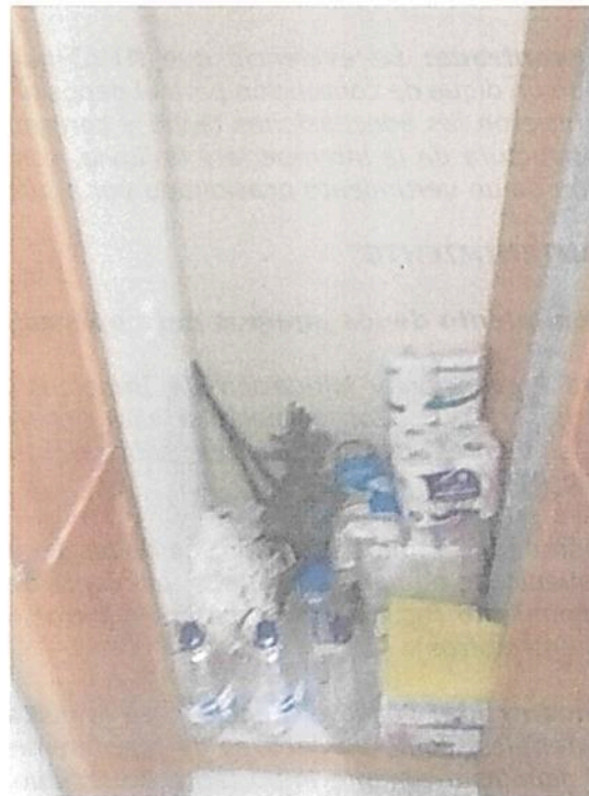
Fotografía 6. Áreas que estaban ocupadas con elementos de aseo y algunos RAEE en los closets de los cuartos en la estación

Por otra parte, se logró evidenciar que se siguen presentando inconvenientes en el almacenamiento, clasificación y acopio de algunos residuos de aparatos eléctricos y electrónicos -RAEE-, así como de elementos de limpieza en áreas no acondicionadas para este propósito.