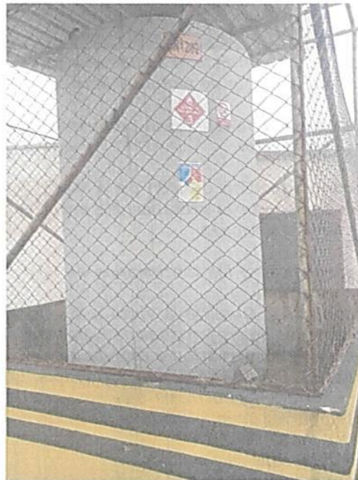
Fotografía 5. Estado actual del cerramiento de la estación con deterioro por la intemperie (cerramiento tanque de ACPM).

Situación encontrada: Según lo observado en la visita se determinó que, el cerramiento de la estación, aunque no se encuentra deteriorado en general, si presenta varios tramos en los que se presenta un grado de oxidación inicial, que demandará un reforzamiento de pintura en próximos meses.