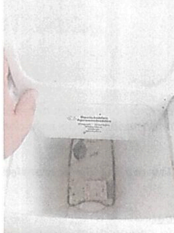
Imagen 7. Presencia de restos de residuos comunes mal dispuestos - Estación Palomino

en los depósitos de residuos aprovechables. Por lo que se hace necesario requerir a COMCEL COMUNICACIÓN CELULAR S.A. (Ahora CLARO S.A. Soluciones Móviles), para que realice una correcta clasificación, acopio y almacenamiento de residuos comunes y peligrosos propios de labores de mantenimiento y operación de la estación. A continuación, se ilustran fotográficamente estos hallazgos: