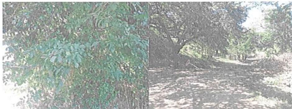
Imágenes 8 y 9. Hallazgos de siembra de cerca viva (limoncillo), corrales, así como madera talada y apilada - Estación Palomino

Se evidenció en la visita que la Sociedad beneficiaria de la autorización, se viene adelantando la consolidación de los registros generados a partir de la implementación de los formatos de seguimiento, que para el caso serían implementados por la Empresa AOM de COMCEL COMUNICACIÓN CELULAR S.A. Sin embargo, durante el recorrido en campo en la cercanía de la estación de Palomino, se pudo evidenciar que en el predio donde esta se ubica, se adelantaron aparentemente la siembra de especies exóticas para cerca viva y sombrío en este caso con la siembra masiva de árboles de Swinglea glutinosa o Limoncillo, que al parecer fueron introducidos por personas que están ocupando irregularmente este predio desde los últimos dos años. También se pudo apreciar la presencia de cercas de corral para ganado -sin presencia de animales- y de madera apiladas producto de socola y tala selectiva en el predio. A continuación, se registra el evento fotográficamente: