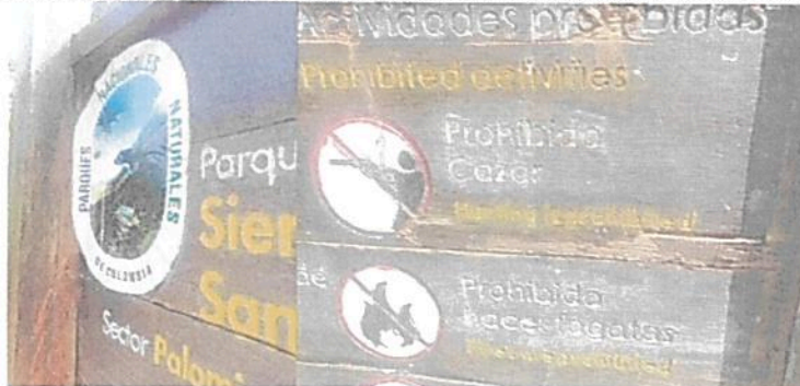
Imagen 1, 2. Vallas pedagógicas sobre cuidado de especies de fauna

Se evidenció en campo que las señales y vallas informativas instaladas, que hacen alusión a la conservación de especies de fauna residente y/o migratoria, aunque se les adelantó un mantenimiento de pintura y barniz; sin embargo, se evidencia que las imágenes institucionales de Parques Nacionales son logos adhesivos que se deterioran fácilmente por acción de la lluvia y el sol, por lo que es necesario que esta imagen sea tallada y pintada directamente en la madera de la valla. Igualmente, otras vallas aún tienen un deterioro de la madera visible.