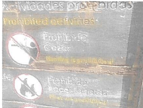
Imágenes 10. Señales con alto grado de deterioro por intemperie pese al mantenimiento

Se evidenció en campo que las señales y vallas de los senderos que conducen a la estación se encuentran en un estado regular con la novedad del deterioro persistente en varias vallas y también en el logo de Parques Nacionales en todas las vallas. Por lo que se requiere que esta imagen sea tallada y pintada directamente en la madera de la valla.