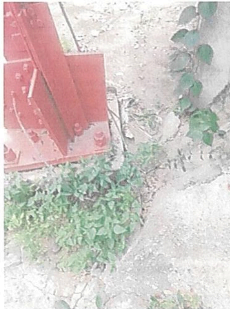
Imagen 4. Hallazgo de cable de acero de tierra deteriorado