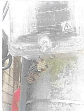
Imagen 3. Hallazgo de un panal de avispas en la estación Palomino

Es importante destacar que durante la visita a esta estación, se logró evidenciar nuevamente la presencia de avispas pegadas a un medidor eléctrico (ver foto), que indica la presencia de algunos hábitats de especies en la estación que requieren de articular acciones con la jefatura del parque, para que estos microhábitats logren ser reubicados en otros espacios del predio o del área protegida, en donde no corran riesgo de ser afectados por las acciones de operación de esta estación de telecomunicaciones.