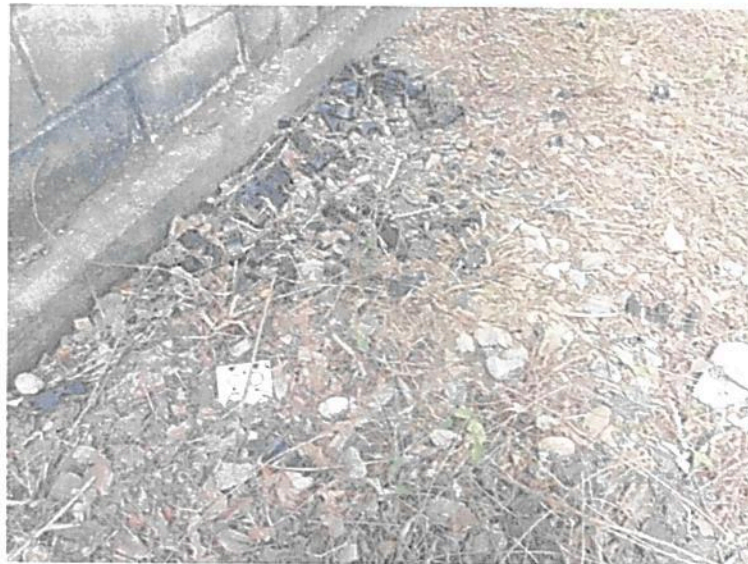
Imagen 4. Presencia de restos de accesorios eléctricos de plástico en el exterior del muro de cerramiento - Estación Don Diego

Se evidenció en la visita que existen algunas fallas en el acopio y almacenamiento de materiales, en este caso por la presencia en alrededores de la estación de restos de accesorios eléctricos plásticos tirados en el suelo. Por lo que se hace necesario requerir a COMCEL COMUNICACIÓN CELULAR S.A. (Ahora CLARO S.A. Soluciones Móviles), para que realice una correcta clasificación, acopio y almacenamiento de residuos comunes y peligrosos propios de labores de mantenimiento y operación de la estación. A continuación, se ilustran fotográficamente estos hallazgos: