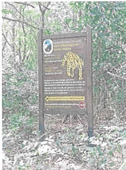
Imágenes 6 y 7. Señales instaladas en inmediaciones de estación Don Diego

Se evidenció en campo que las señales y vallas de los senderos que conducen a la estación recibieron mantenimiento correctivo frente a su deterioro (ver imágenes 6, 7 y 8). Por lo anterior no se reporta la necesidad de adelantar requerimiento de parte de esta Autoridad Ambiental diferente al de acreditar los registros de esta ficha de manejo ambiental.