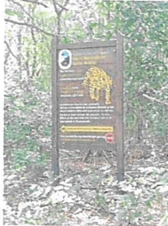
Imagen 1. Valla educativa sobre cuidado de especies de fauna

se les adelantó un mantenimiento de pintura y barniz; sin embargo, se evidencia que las imágenes institucionales de Parques Nacionales son logos adhesivos que se deterioran fácilmente por acción de la lluvia y el sol, por lo que es necesario que esta imagen sea tallada y pintada directamente en la madera de la valla.