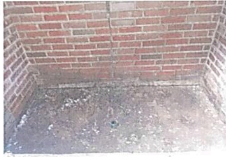
Imagen 3. Hallazgo de una posible infiltración de combustible en el piso de dique de contención de derrames en la estación Don Diego

Se evidenció en la visita que el suelo del dique de contención en donde reposan los tanques de combustible ACPM, que alimentaban las plantas eléctricas, presenta infiltración en el concreto, al parecer por fallas en la impermeabilización del mismo, por lo que deberá adelantarse el traslado temporal de los tanques, la demolición y remoción del concreto contaminado (con tratamiento de RESPEL) y la fundición de un nuevo sustrato en el dique con su respectivo proceso de sellamiento ante combustibles.