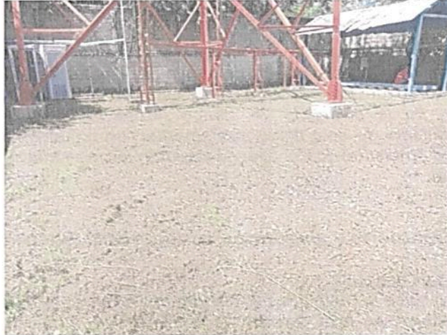
Imagen 5. Mantenimiento (poda) de pastos y plantas herbáceas al interior de la Estación Don Diego

“POR MEDIO DEL CUAL SE HACEN UNOS REQUERIMIENTOS A LA SOCIEDAD COMUNICACIÓN CELULAR S.A. –COMCEL S.A. Y SE TOMAN OTRAS DETERMINACIONES – EXPEDIENTE PANT DTCA 011-06”