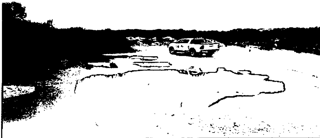
Vista de la zona de extracción de material

"POR MEDIO DE LA CUAL SE INICIA UN PROCESO SANCIONATORIO AMBIENTAL Y SE DICTAN OTRAS DISPOSICIONES"