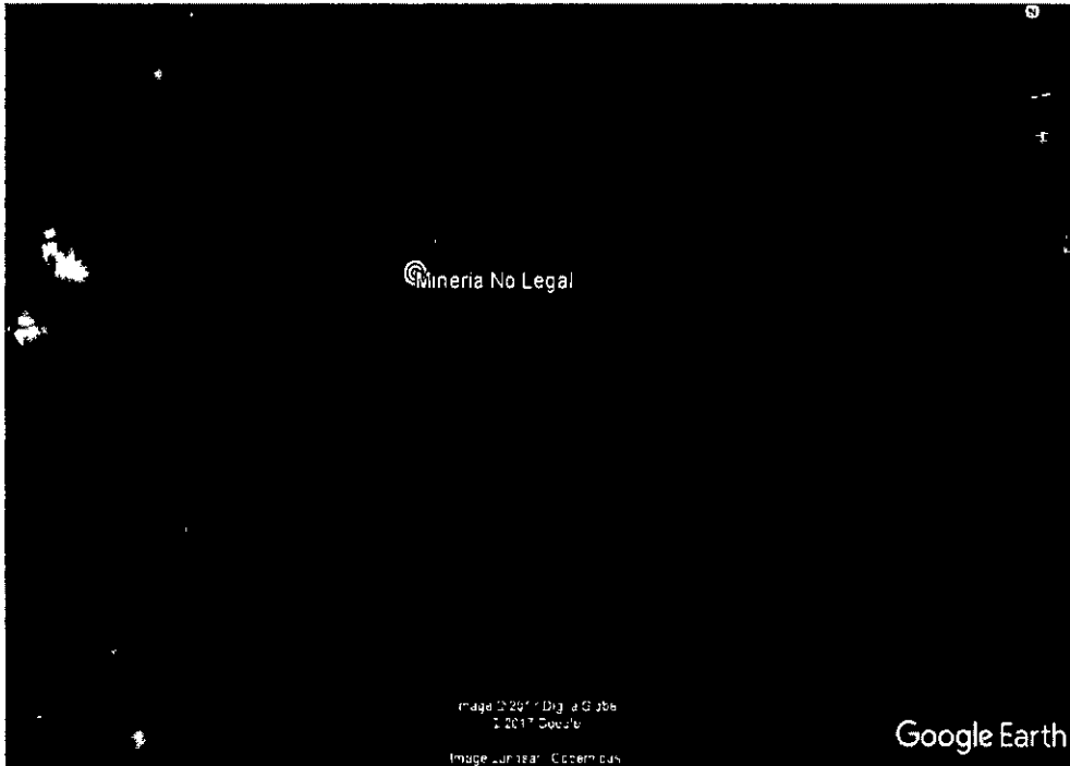
Imagen 2. Sitio de la presunta infracción al Interior del PNN Sierra de la macarena

El área afectada no presenta vegetación, al sur corresponde a áreas con pastos, al oriente se aprecia vegetación en proceso de restauración, al norte se aprecian pastos, y occidente bosques ribereños. El caño apreciado corresponde a un tributario de caño Ánimas. El área explotada tiene una extensión de 1,7 Ha.