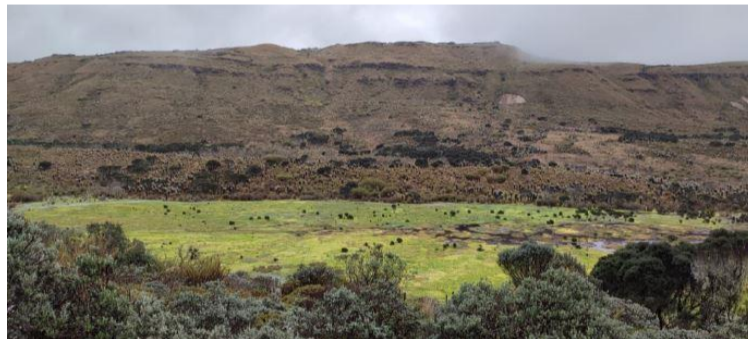
Foto 5. Punto sobre vía Troncal Bolivariana al sur del cruce de Alto Caicedo coordenadas 74°15'04" O - 4°06'36" N. Sector despoblado.

El día 19 de enero de 2022, el equipo de trabajo del Parque Nacional Natural Sumapaz realizó nueva visita al lugar objeto de esta indagación para prevenir incendios, cuyos resultados obran en el formato de actividades de prevención, vigilancia y control del mismo día, sin observar novedad alguna.