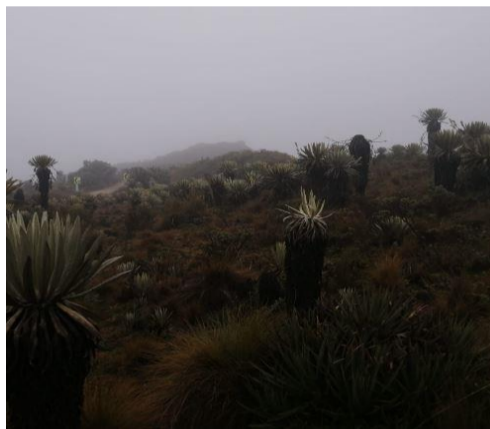
Foto 4. Punto sobre ramal que conduce a vereda las Ánimas, coordenadas 74°13' 46.62" O - 4°08'16.25" N. Sector despoblado.