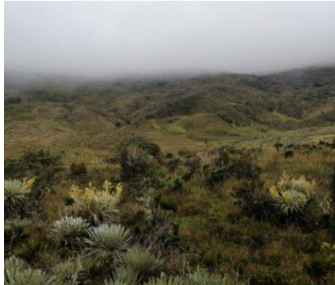
Foto 3. Área aledaña al incendio, coordenadas 74°13' 54.96" O - 4°06'47.99" N. Sector sin viviendas cerca.

incendio hace parte de un amplio sector con coberturas vegetales de páramo, inhóspito, despoblado, sin casas ni fincas. Por lo tanto, no se pudo indagar acerca de la identidad del presunto infractor según lo ordenado en el artículo 2 del Auto Número 023 del 15 de marzo de 2021 (fotos 3 a 5).