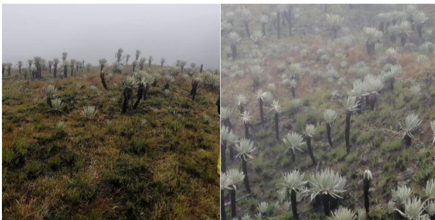
Fotos 1 y 2. Evidencias de buena recuperación de la flora afectada por incendio del 13 de diciembre de 2020 detectadas el día 19 de junio de 2021.

Posteriormente, atendiendo lo requerido en el artículo 2 del Auto número 023 del 15 de marzo de 2021 emitido por la Dirección Territorial Orinoquía de Parques Nacionales Naturales de Colombia, integrantes del equipo del PNN Sumapaz se dirigieron nuevamente al área afectada el día 19 de junio del 2021, (coordenadas 74°13' 35.37" O - 4°06'53.45" N) y establecieron que la vegetación del punto donde ocurrió el incendio tiene una buena recuperación, esto debido al parecer por los altos niveles de humedad que se presentan en esta zona. Se observa que no se han presentado nuevos puntos de fuego y no se detecta presencia de personas ni de ganado en el sector afectado. Tampoco se han establecido cultivos. No se observan nuevas presiones al ecosistema posteriores al incendio de diciembre de 2020 (fotos 1 y 2).