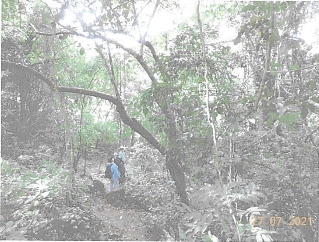
Figura 1. Profesionales y propietario en los recorridos realizados al predio "Parcela 11".