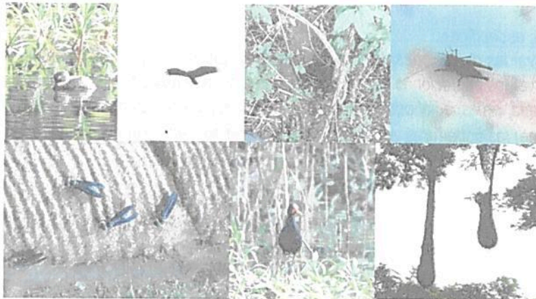
Figura 3. Algunos registros de fauna captados durante los recorridos.

De acuerdo con la reseña descriptiva y lo comentado por el propietario, en el predio se han reportado especies como venado ( Mazama americana ), guartinaja ( Cuniculus paca ), ñeque ( Dasyprocta punctata ), armadillo, ( Dasypus novemcinctus ), zaino ( Pecari tajacu ), colorados ( Alouatta seniculus ), titilíto ( Saguinus oedipus ), guacharaca ( Ortalis sp. ), tucan caribeño ( Ramphastos sulphuratus ), psitácidos ( Guacamayas , pericos, loros), entre otras.