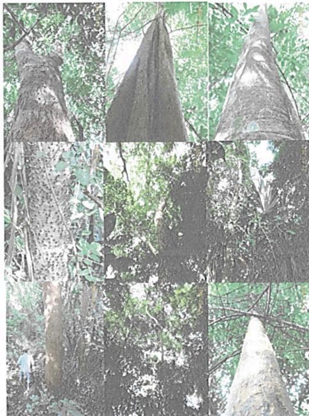
Figura 4. Muestra de la flora evidenciada en campo.

En los recorridos se encontró variedad de especies propias del Bosque Seco Tropical, Guacamayo ( Albizia niopoides ), resbalamonos ( Bursera simaruba ), mamón de maría ( Melicoccus oliviformis ), guayacan ( Bulnesia arborea ), polvillo ( Tabebuia sp.), roble ( Tabebuia rosea ), lomo de caimán ( Platypodium sp.), orejero ( Enterolobium cyclocarpum ), camajón ( Sterculia apetala ), hobo ( Spondias mombin ), ceiba de leche ( Hura crepitans ), cuchillito ( Senna sp.), membrillo ( Gustavia superba ), cocuelo ( Lecythis minor ), entre otros.