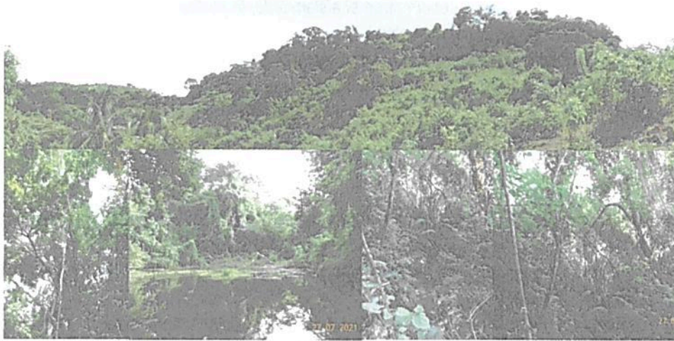
Figura 6. Vistas de varios sectores del área de conservación en el predio "Parcela 11".

El área de conservación comprende el 51,42% (4,3854 ha.) del total del área a registrar. Comprende un bosque denso a abierto con árboles de gran porte, se aprecia vegetación arbustiva en los bordes del área de conservación. La zona de conservación incluye un espejo de agua rodeado de un bosque abierto, lo que atrae fauna silvestre representativa del bosque seco tropical y es un refugio de interés para la observación de aves y primates.