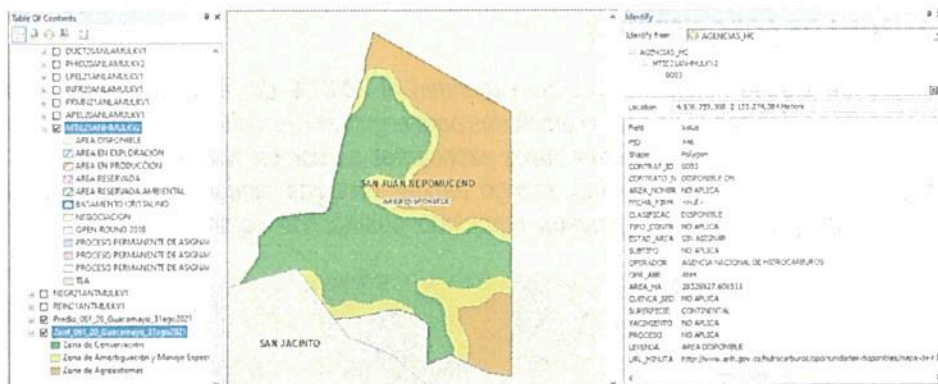
Figura 8. Resultado de la revisión de traslapes con el predio "Parcela 11" identificada con FMI No. 062-28480, donde se aprecia que se encuentra en un área sin asignación por parte de la ANH.

Mediante solicitud del 27 de agosto de 2021 al Grupo de Sistemas de Información y Radiocomunicaciones se solicitó la verificación de traslapes con áreas protegidas, títulos mineros o proyectos de hidrocarburos y comunidades étnicas. Como resultado de esta revisión solo se encontró traslape con un polígono que actualmente está sin asignación por parte de la Agencia Nacional de Hidrocarburos (Figura 8).