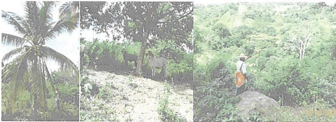
Figura 7. Algunas imágenes de la Zona de Agrosistemas "Parcela 11".

Comprende 2,9688 hectáreas que corresponden al 34,81% del área propuesta para registro. Está compuesta por las zonas de pastos arbolados para el ganado de leche principalmente. Asimismo, incluye las zonas de cultivos de pancoger cuyos excedentes se comercializan en el mercado local y que se compone de ñame, maíz, plátano, mango tommy, naranjas, aguacate mandarina, níspero, papaya cereza, limón (criollo y tahiti), guayaba, tamarindo, guama, coco, entre otros.