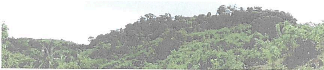
Figura 2. La muestra ecosistémica está compuesta principalmente por un bosque abierto alto y cercana a un arroyo intermitente.