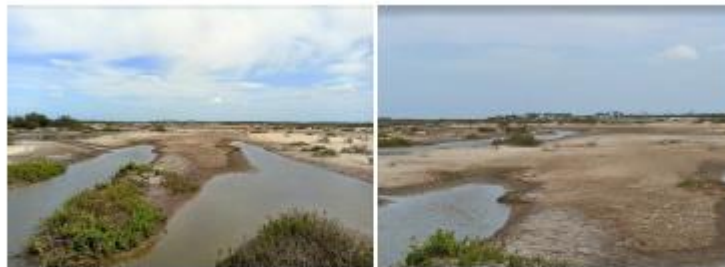
Figura 5: Cuarto punto de seguimiento dentro del área del SFFF. Coordenadas 11°25'9.41"N 73° 4'33.05"O.

Nota: Línea continua de la corriente de agua dentro de la zona de desborde de la Laguna Navío Quebrado.