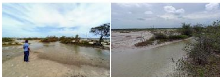
Figura 6: Quinto punto de control dentro del SFFF. Coordenadas 11°25'12.99"N 73° 4'42.23"O.

Nota: Se puede observar al fondo la Laguna Navío Quebrado y la comunidad de Loma Fresca.