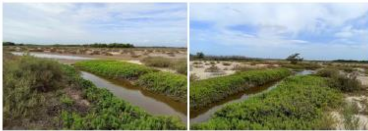
Figura 4: Tercer punto de seguimiento dentro del área del SFFF. Coordenadas 11°25'6.86"N 73° 4'24.76"O.

Nota: Se puede observar la corriente de agua dentro de los límites del AP. Al final se puede observar la planta de tratamiento de agua del corregimiento de Camarones.