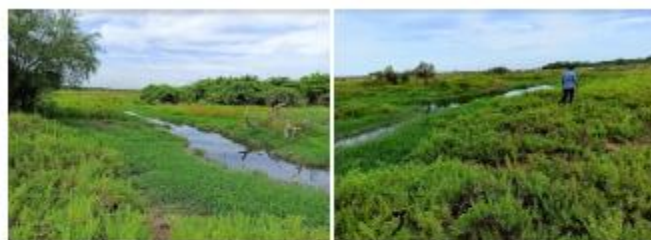
Figura 2: Primer punto de seguimiento al borde del manhole, fuera de los límites del SFFF Recorrido. Coordenadas 11°25'8.98"N 73° 4'10.48"O.

Nota: Se puede observar la corriente de agua que sale del manhole y se dirige hacia la laguna Navio Quebrado.