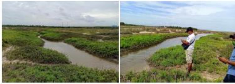
Figura 3: Segundo punto de control sobre la línea de los límites del SFFF. Coordenadas 11°25'6.88"N 73° 4'20.34"O.

“Por el cual se formulan cargos la ALCALDIA DISTRITAL DE RIOHACHA y se adoptan otras determinaciones”