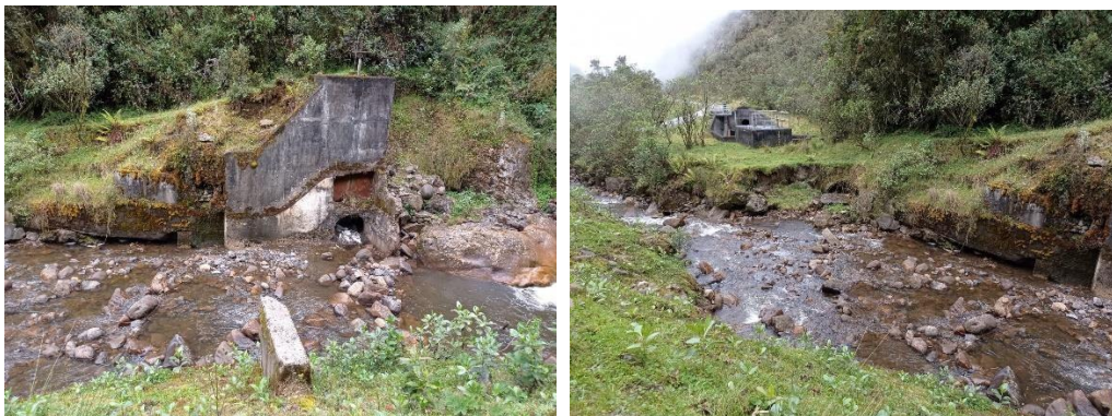
Fotos 1 y 2. Quebrada El Mangón

Actualmente no existe infraestructura sobre la fuente hídrica