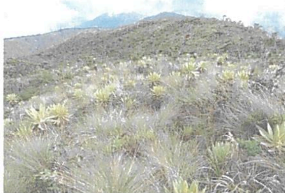
Imagen 1: RNSC 003-18 "EL SILENCIO".