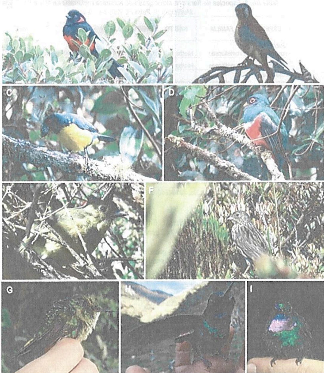
Imagen 2. Registro fotográfico de campo CVC: A: Anisognathus igniventris; B: Falco sparverius; C: Buthraupis montana; D: Trogon personatus; E: Grallaria quitensis; F: Phrygilus unicolor; G: Opisthoprora euryptera; H-I: Heliangellus exortis.