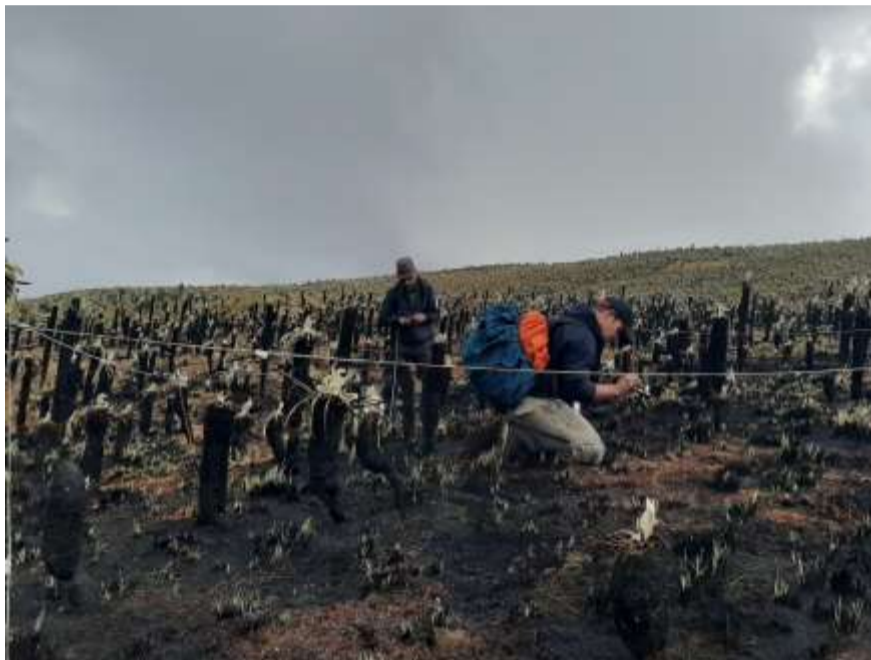
Fotografía 2. Montaje parcelas para estimar afectación incendio, cobertura 321111 (herbazal denso de tierra firma no arbolado)