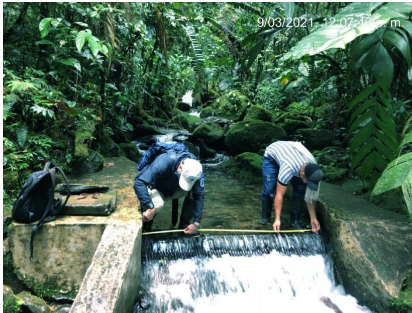
Foto 4. Bocatoma Las Agüitas, rejilla de fondo