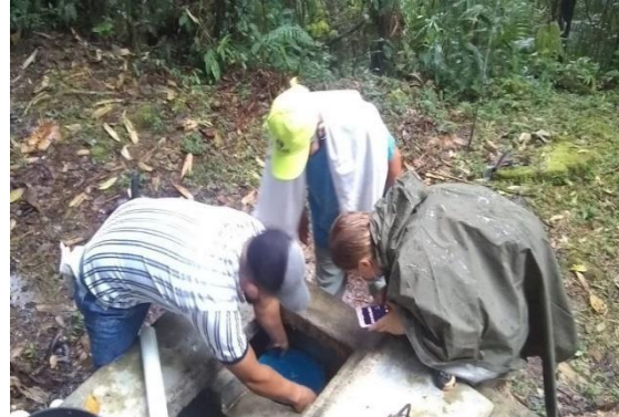
Fotos 1 y 2. Aforo volumétrico entrada Sistema