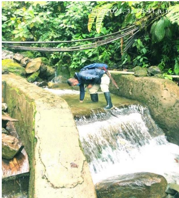
Foto 3. Bocatoma Río Claro

El sistema de captación corresponde a una bocatoma No 1 de fondo ubicada en la quebrada Río Claro, construida en concreto, que tiene aproximadamente 3.50 m de ancho por 1.10 m de alto, cuenta con una rejilla y tubería de desagüe para la limpieza de sedimentos.