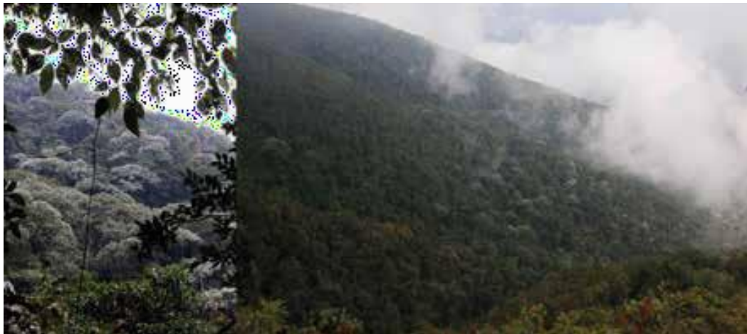
Figura 2. Flora observada en la RNSC "MADHU".

exclusiva de los bosques de roble, así como muchas otras especies que muestran la gran diversidad de estos ambientes y la importancia que tienen.