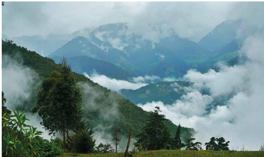
Figura 1. Muestra de ecosistema: Bosque de Alto Andino observado en la RNSC "MADHU". – Dossier – reserva MADHÚ