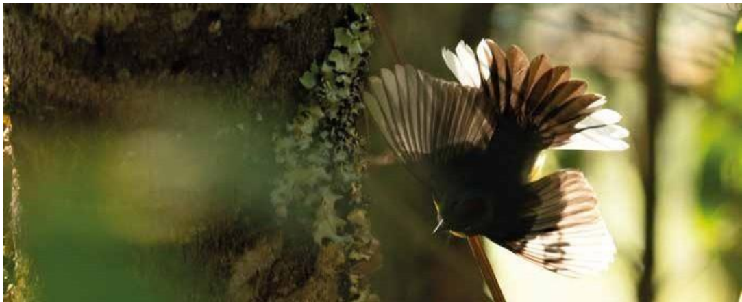
Figura 4. Aves Myioborus miniatus en la RNSC "MADHÚ".