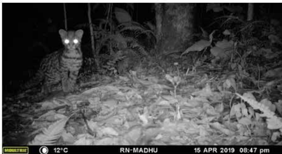
Un individuo Oncilla (Leopardus pardalis)