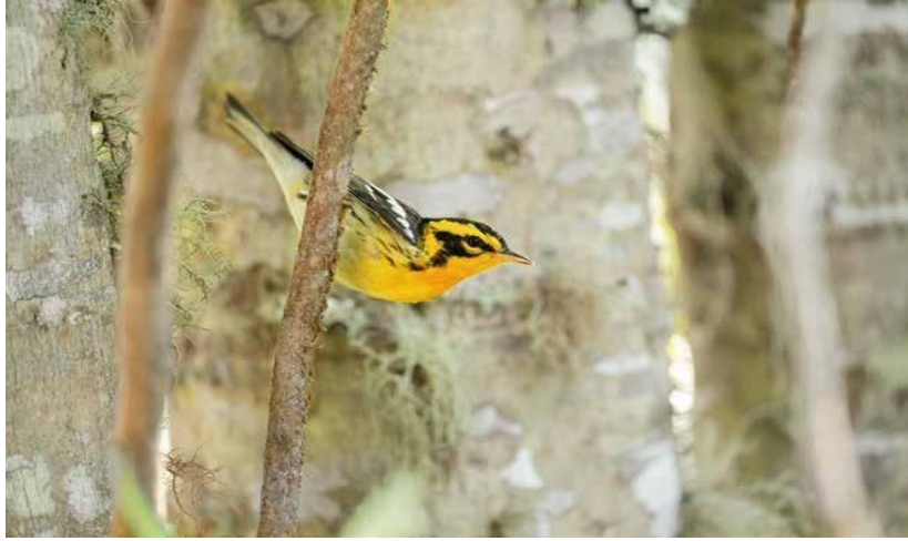
Figura 3. Aves ( Setophaga fusca ) en la RNSC "MADHÚ".