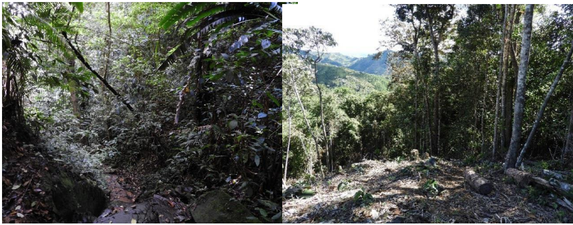
Foto de ecosistema representativo de la RNSC LOTE RURAL (Fuente: Concepto Técnico DTAO 13/11/2019).

Durante la visita, se evidenció que existe una muestra de ecosistema natural de Bosque Andino en buen estado de conservación. Al interior del predio afloran algunos nacimientos de agua, también se evidenció una gran diversidad de fauna representada en aves y flora con especies nativas propias de la región.