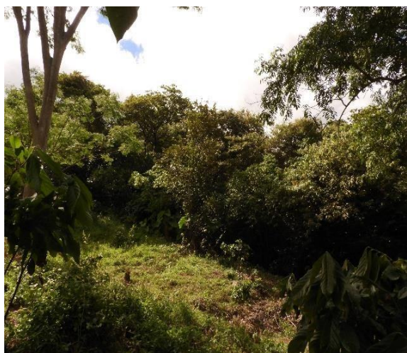
Fotografía 1. Muestra de bosque seco