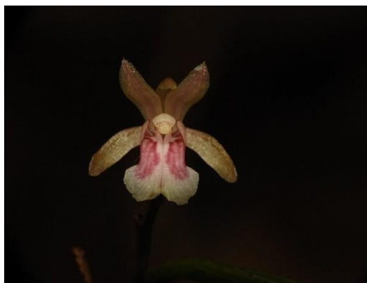
Fotografía 5. vegetación

Dentro de la descripción presentada en la reseña descriptiva, con respecto a la flora, se identificó un bosque seco en avanzado estado de madures con representación de las siguientes especies; Dinde, Payandé, Piñón de oreja, Diomate, Matarratón, brevo (Lechudo), Caracolí, estos con representación arbórea de gran tamaño, la mayoría de los árboles con alturas hasta de 10 y 12 metros. La zona periférica del bosque, comprende estados sucesionales de rastrojos conservados representados en arbustos menores como, manzanillo, carate, melastomatáceas, y algunas leguminosas arbustivas.