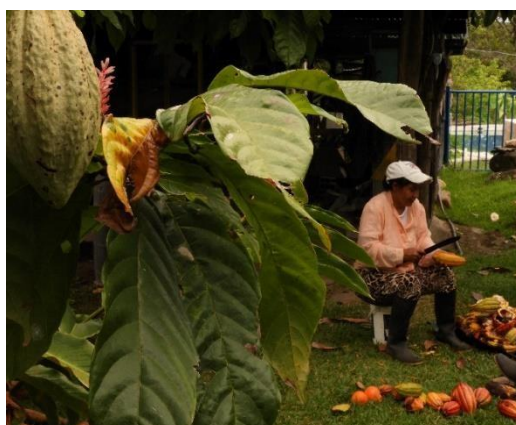
Fotografía 7 y 8. Procesado del cacao para elaborar productos derivados.