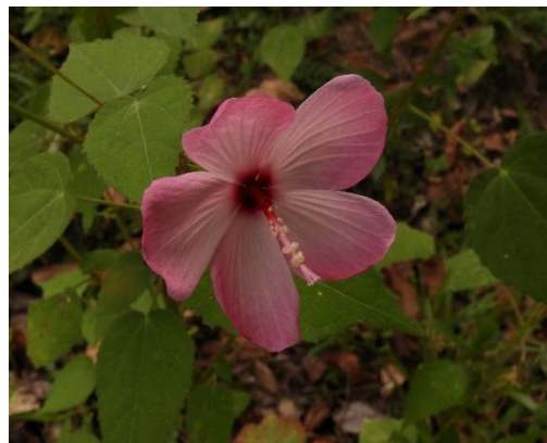
Fotografía 6. vegetación