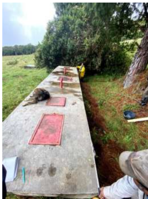
Imagen 4. Estructura del desarenador