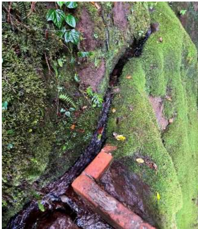
Imagen 2. Condiciones del punto de captación