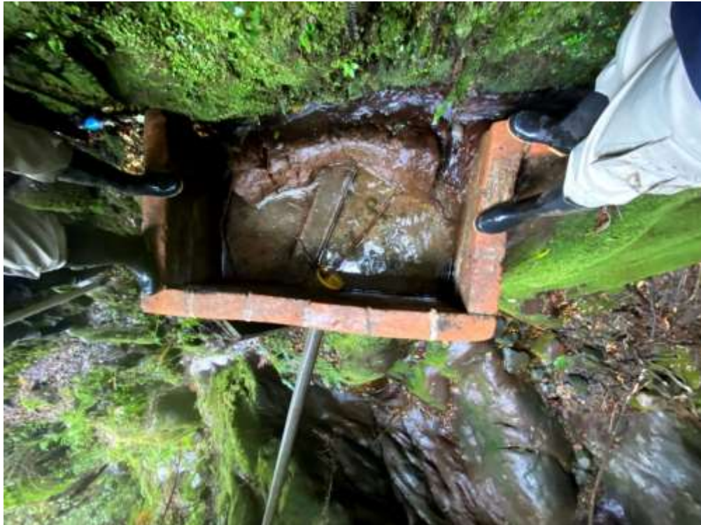
Imagen 3. Estado actual de la bocatoma.