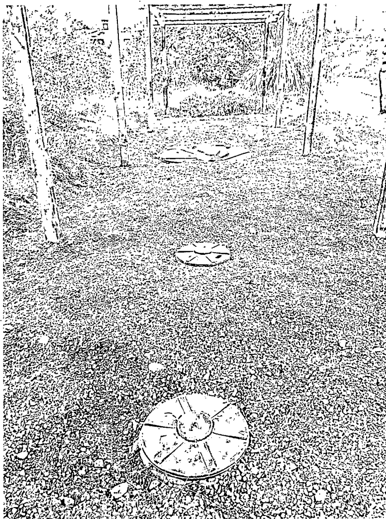
Imagen 1. Estado Actual del STARD

En cuanto a las condiciones físicas del sistema algunas tapas de los tanques se encuentran rotas y/o hundidas, esto se debe principalmente a que el área donde se ubica el sistema no se encuentra cercado, lo cual permite el paso de fauna y el tránsito de este sobre las tapas del sistema, por lo tanto, se solicita cercar la zona y reemplazar las tapas rotas, esto con el fin de que el sistema funcione adecuadamente, y no se ponga en riesgo la fauna de la zona.