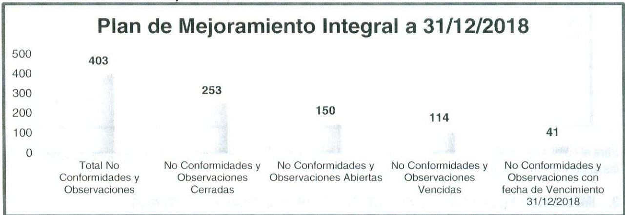
Gráfica No.1 Estadísticas Plan de Mejoramiento a 31/12/2018

La vigencia 2018 finalizó con 150 No Conformidades y/u Observaciones abiertas de las cuales 114 se encontraban con fecha de cumplimiento vencida, de la cuales 41 se vencieron el 31/12/2018. De acuerdo a la gráfica anterior, establecer fecha de cumplimiento para el último día de diciembre, incrementa los vencimientos, que cualquier otro momento del año.