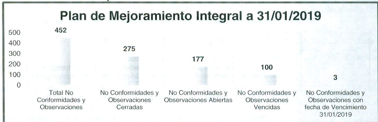
Gráfica No.2 Estadísticas Plan de Mejoramiento a 31/01/2019

En la gráfica anterior, se puede observar un incremento de las No Conformidades y/u Observaciones abiertas para el 31/01/2019, con respecto al cierre de la vigencia 2018. Esto se debe a que se suscribieron en el mes de enero, nuevos planes de mejoramiento producto de las auditorías de la vigencia anterior.