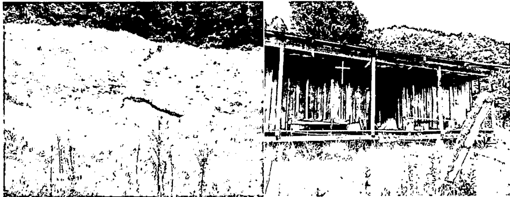
Figura 3. Zona de Agrosistemas y Zona de Uso Intensivo en Infraestructura de la RNSC "EL JARDÍN" de acuerdo con la sección 17 del Decreto 1076 de 2015.